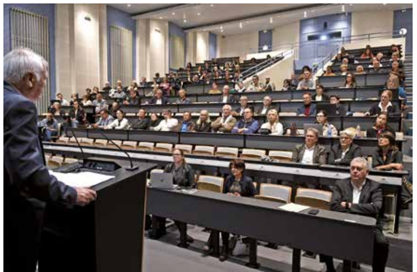
Présentation officielle du 10 octobre 2024 de la 11 e édition de Carrefour de l'orientation des métiers et de l'entreprise.

Pour toutes vos demandes : journaldelorientation@choletagglomeration.fr