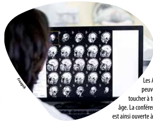
Les AVC peuvent toucher à tout âge. La conférence est ainsi ouverte à un large public.

« Cette manifestation annuelle est toujours attendue car elle permet de suivre les nombreuses évolutions médicales et peut rassurer, poursuivent les membres d'Atout cœur, riche de 115 adhérents de 50 à 90 ans. C'est aussi l'occasion d'échanger simplement, comme lors de nos matinées gymnastique adaptée,