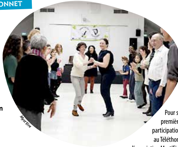
Pour sa première participation au Téléthon, l'association Myst'Eire avait organisé une Celtic party très appréciée, reconduite cette année.

Quelques jours plus tôt que d'habitude, en raison de l'inauguration de la cathédrale Notre-Dame à Paris programmée le samedi 7 décembre, le Téléthon appellera à la mobilisation en faveur de la recherche contre les maladies génétiques, les vendredi 29 et samedi 30 novembre prochain. Si le village se tiendra bien à la fin du mois à Cholet, les animations commencent plus tôt encore ! Avec l'espoir de récolter autant de fonds que l'an passé. Meilleure contributrice du département en 2023, l'association Vive la vie, qui porte le combat localement, avait réversé la somme record de 63 777 € à l'AFM-Téléthon, permettant de financer, à son échelle, les recherches médicales.