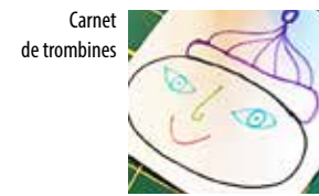
Carnet de trombines