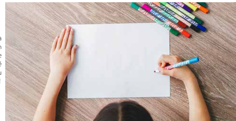
Pendant tout ce mois de novembre, les enfants sont invités à s'exprimer. Peu importe la manière...

Entrée gratuite pour les enfants et un accompagnateur. Inscription au 02 72 77 23 22