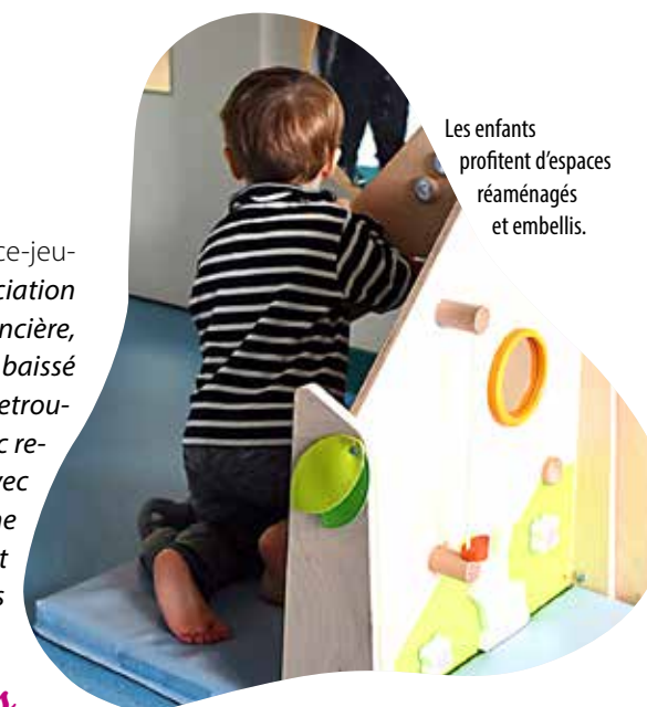
Les enfants profitent d'espaces réaménagés et embellis.

« La différence avec la halte-garderie, c'est aussi que nous fournissons les couches, fran-