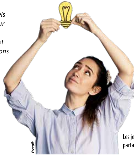
Les jeunes peuvent partager leurs idées.