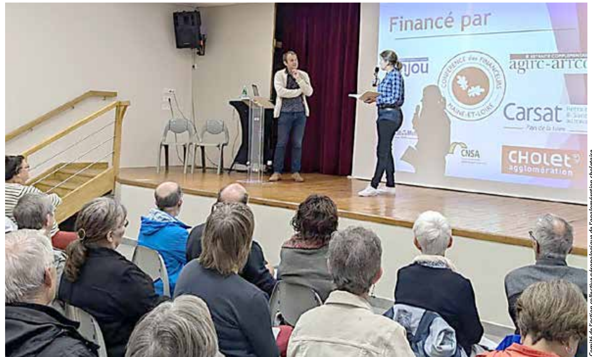
Comité de l'action collective gérontologique de l'agglomération choletaise

Grâce à une conférence, un spectacle et des ateliers, ces seniors ont pu obtenir différents outils pour trouver leur positionnement et jauger leur investissement.