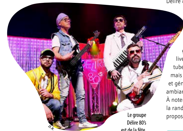
Le groupe Délire 80's est de la fête.