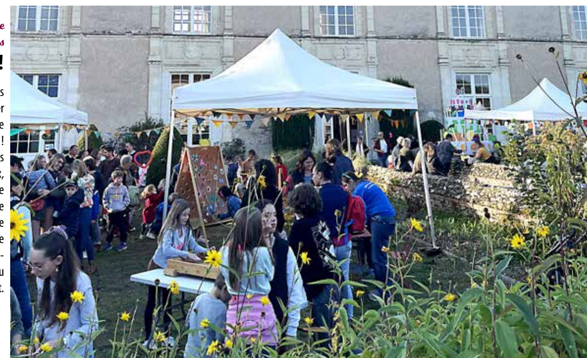
Le Coin de la rue

Entre la parade colorée, les animations musicales, les jeux, les balades à poney, le musée anniversaire et un spectacle de cirque aérien magique, ce public a profité d'une journée inoubliable, depuis le centre-ville de Vihiers, jusqu'au château de Maupassant.