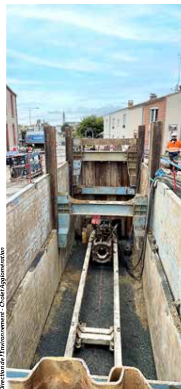
Direction de l'Environnement - Cholet Agglomération

Vous avez peut-être aperçu, dans l'espace public, des petits appareils blancs fixés en hauteur, par exemple, sur des candélabres. Parfois confondus avec des caméras, il n'en est rien. Il s'agit de répéteurs, mis en place dans le cadre de la télérelève, qui réceptionnent le volume des consommations des abonnés pour les relayer jusqu'au centre de traitement des données du service de l'eau. Les ondes radio diffusées sont de très faible puissance et de très faible durée.