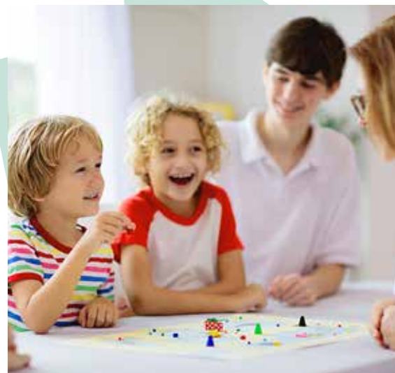
Jouer est un bon moyen de s'exprimer.