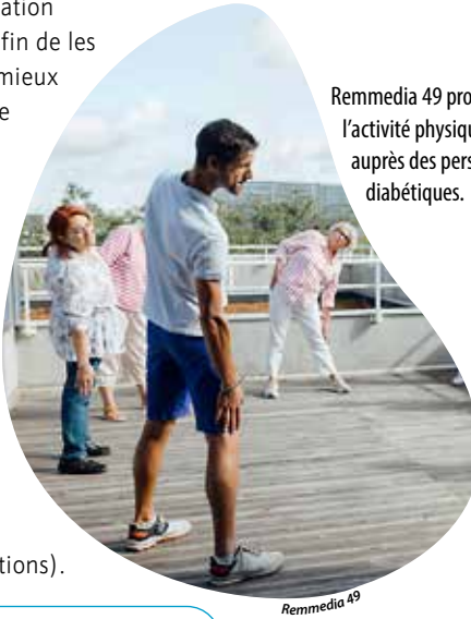
Remmedia 49 promeut l'activité physique auprès des personnes diabétiques.

Tél. : 02 41 44 05 38 www.remmedia49.fr Entrée libre