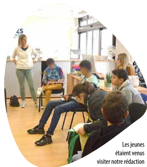
Les jeunes étaient venus visiter notre rédaction en septembre dernier.

Les professionnelles – éducatrices, psychologues, psychomotriciennes et orthophonistes – interviennent ainsi auprès des jeunes lors de rendez-vous individuels ou collectifs dans les locaux de la structure et, surtout, à la maison ou au collège. « Notre mission est de les aider à se maintenir dans leurs lieux de vie