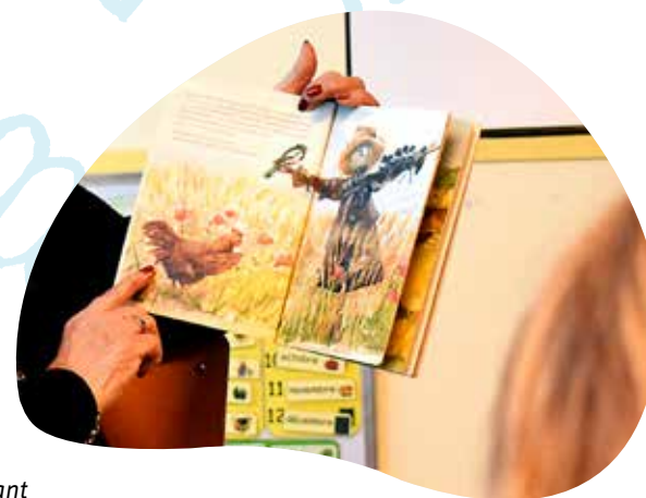
Les enfants attendent souvent avec impatience ce rendez-vous hebdomadaire.

Vous avez plus de 50 ans, adorez lire et avez l'envie de transmettre cet amour des mots ? Cette mission est sans doute pour vous !