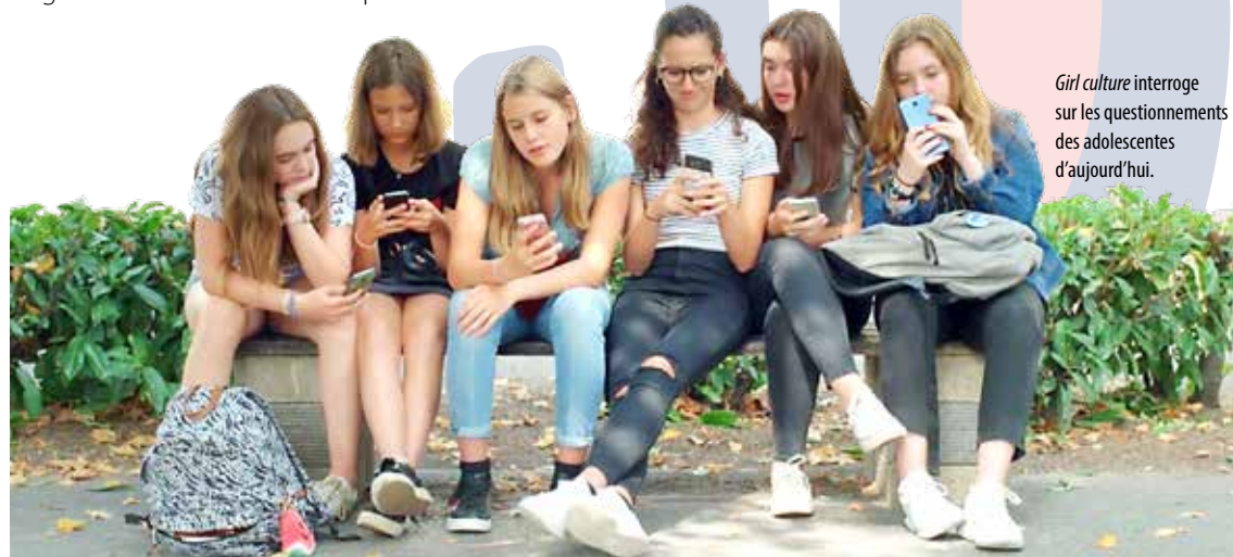
Girl culture interroge sur les questionnements des adolescentes d'aujourd'hui.