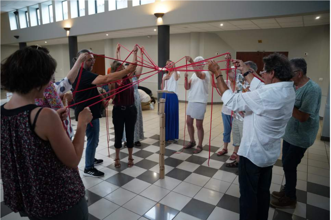
Pacte de coopération – juin 2023 : jeu coopératif (CAF/Centres sociaux/élus locaux et communautaires)