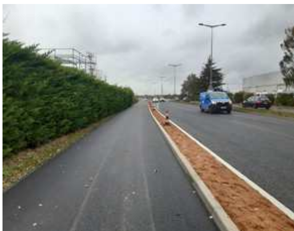
Boulevard du Maine