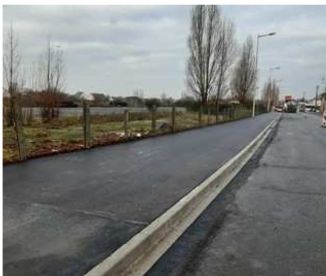
Boulevard de Strasbourg