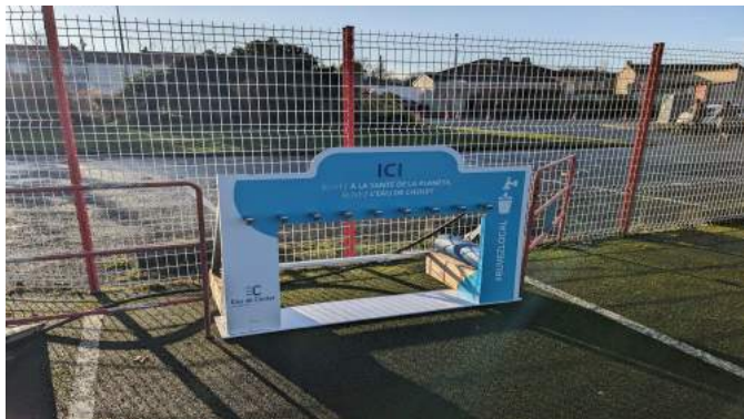
Rampe à eau