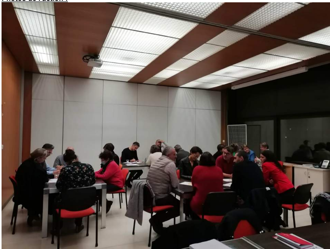
groupe de travail intercommunal sur le numérique (élus, services, partenaires) 11-2023