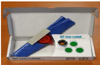
Kit économie eau