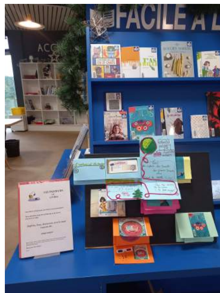
Mise en valeur du fonds " Facile A Lire " : réalisation d'un lapbook