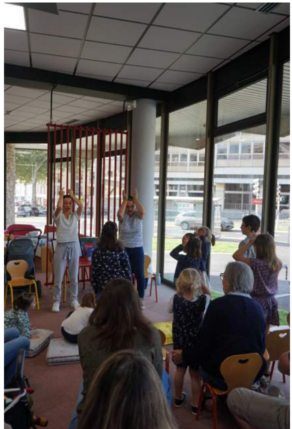
Journée nationale Makaton (30 septembre) : lectures d'histoires signées