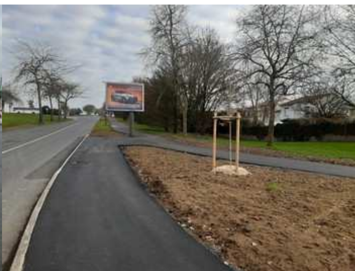
Boulevard du pont de Pierre