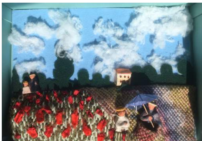
Semaine EJA : interprétations tactiles de Gabrielle SAUVILLERS : le champ des coquelicots / Monet