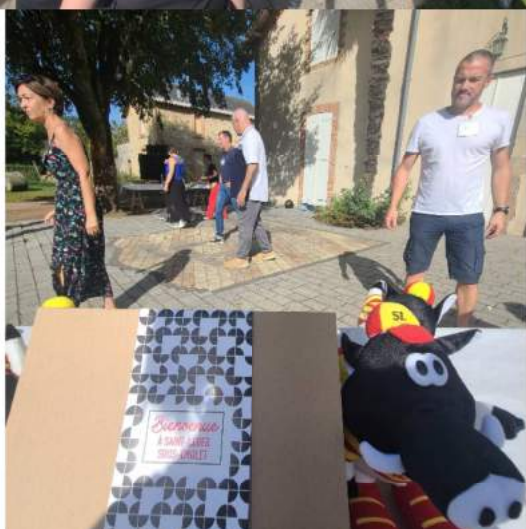
2/ Coffret du nouvel arrivant