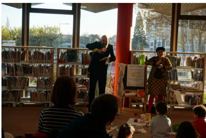
Semaine EJA : spectacle de sensibilisation à la langue des signes