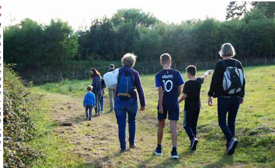
Mairie de Toutlemonde

Les marcheurs ont profité des belles lumières de début de soirée, tombant sur la campagne environnante, lors de la randonnée portée par l'association Zoodo Toutlemonde Yargo et la Municipalité, ponctuée d'étapes gourmandes. Après l'effort, le réconfort, c'est bien connu! Petits et grands ont ainsi terminé la journée en musique, avec la prestation du groupe Phenix, dans le jardin du presbytère.