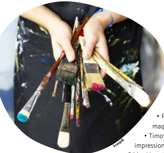
L'exposition est présentée ces samedi 5 et dimanche 6 octobre.