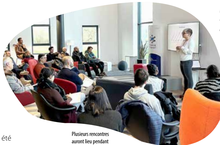
Plusieurs rencontres auront lieu pendant cinq jours.

En 2023, près de 1300 entreprises ont été créées sur le Choletais, pas moins de 10000 en Maine-et-Loire. Un forum de la création reprise d'entreprise se déroulera le mercredi 16 octobre, de 14 h à 18 h, à la Filature numérique. Une quarantaine de structures de l'accompagnement et du financement de la création reprise d'entreprise sera présent pour répondre à toutes les questions.