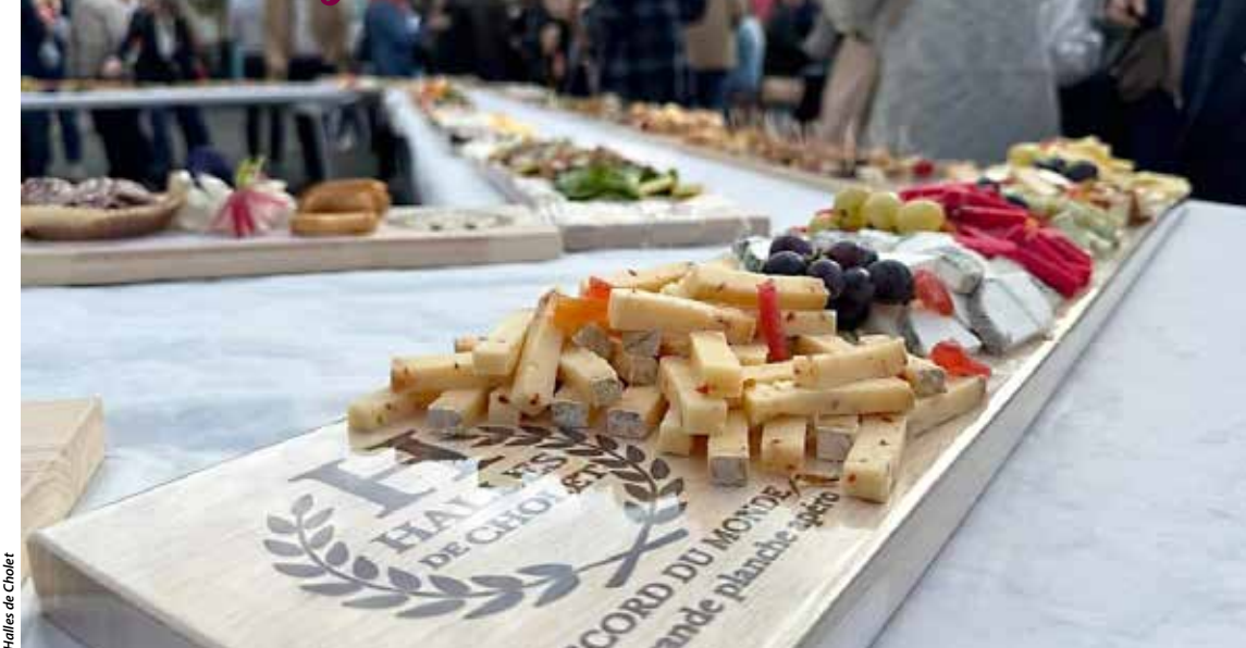
Halles de Cholet