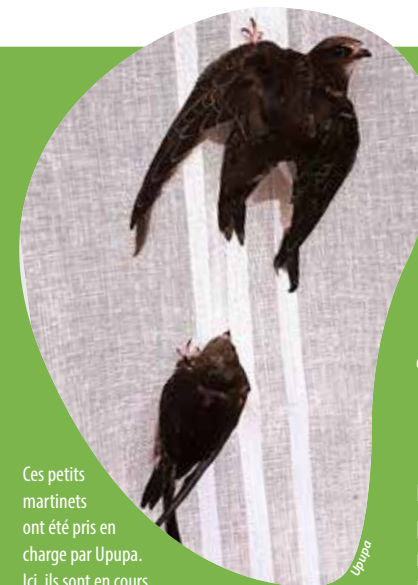
Ces petits martinets ont été pris en charge par Upupa. Ici, ils sont en cours d'entraînement au vol, en vue de les relâcher.