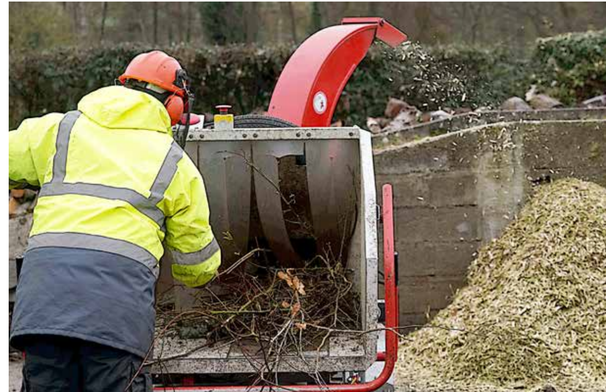
Le broyage vous intéresse? Un guide spécifique est disponible en téléchargement sur cholet.fr.