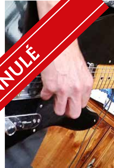
L'ambiance sera assurément rock, ce samedi 5 octobre, pour le concert de Nightfall à Interlude.