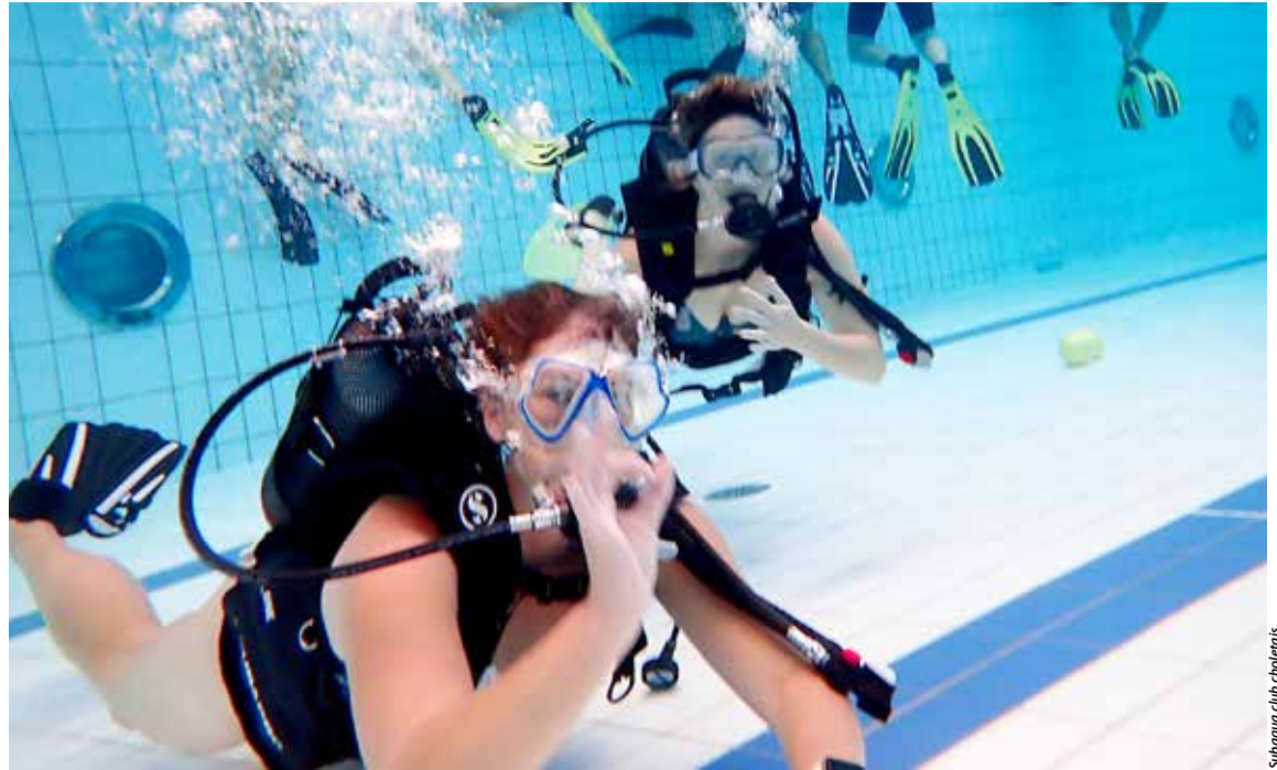
Subaqua club choletais

Escalade, plongée, yoga, karaté, volley-ball, cyclisme, hockey sur glace, badminton, gymnastique, capoeira, rugby... Il était impossible de ne pas trouver son bonheur pour se dépenser et s'amuser lors de l'événement Sport en famille. Enfants et parents ou grands-parents étaient invités par l'Office municipal du sport et ses clubs partenaires pour des initiations gratuites, idéales pour choisir une activité en cette rentrée.