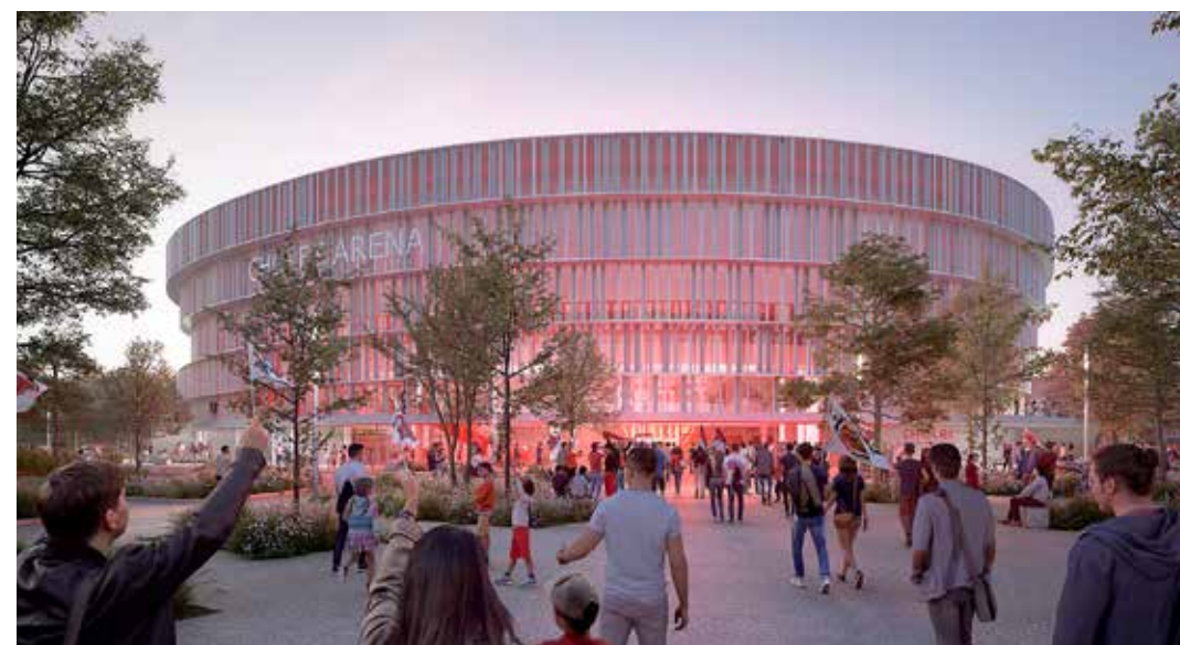
Chabanne architecte, Grégoire architectes, AER studio et Cholet Agglomération

Des espaces sportifs, d'autres dédiés au club résident (administration et centre d'entraînement) et des salles médias compléteront ce projet biosourcé, modèle d'exemplarité en termes d'approche environnementale. « Les lignes courbes, en plus de faire écho à l'histoire textile de la Ville de Cholet avec les trames verticales, permettent à cet équipement d'être le plus performant possible, en optimisant les surfaces déperditives sur le volume à chauffer. La chaufferie bois couvrira l'intégralité des besoins de chaleur du bâtiment de 13 523 m 2 ,