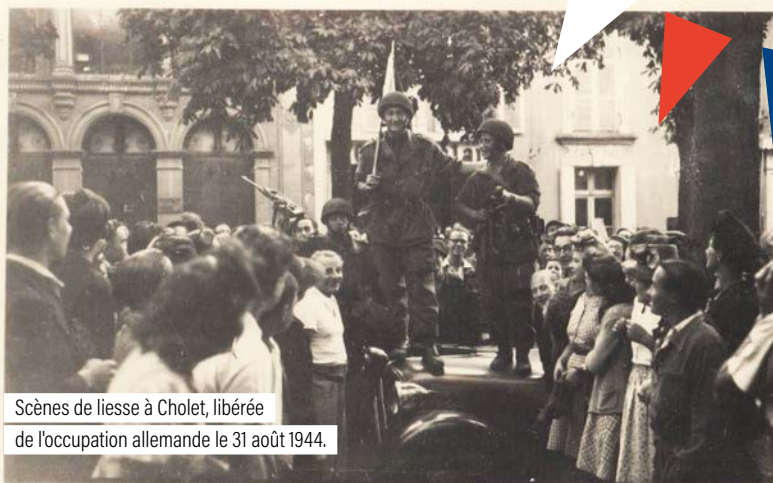
Scènes de liesse à Cholet, libérée de l'occupation allemande le 31 août 1944.

À l'occasion des 80 ans de la Libération de Cholet, la Société des Sciences, Lettres et Arts et le Groupe Choletais de Reconstitution Historique, avec le soutien de la Municipalité, organisent un temps fort commémoratif samedi 31 août. Le temps du week-end, la ville se met aux couleurs de la Libération !