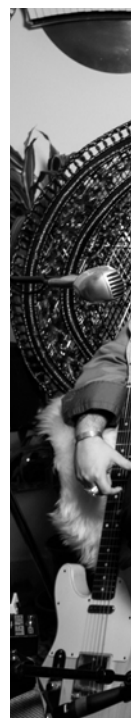
vendredi 5 juillet - 20h30

Le festival Un Air d'été est de retour au Parc de Moine du 4 au 7 juillet.