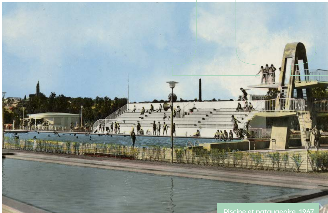
Piscine et pataugeoire, 1967