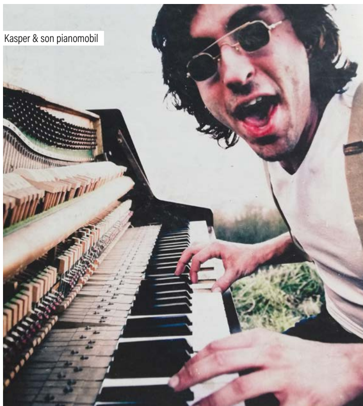
Kasper & son pianomobil