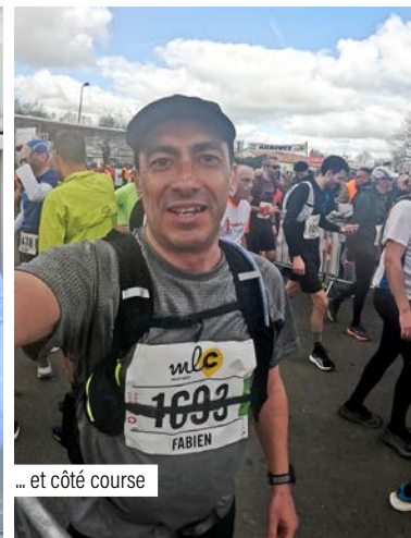
... et côté course