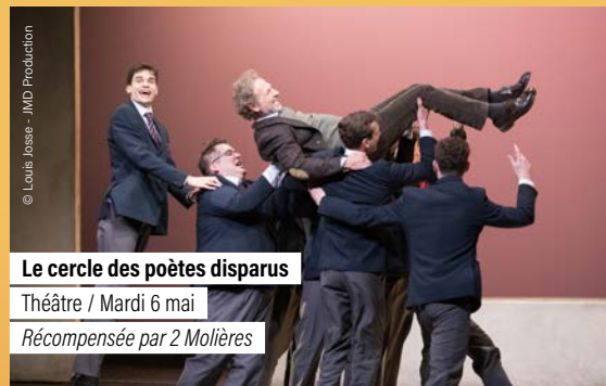
Le cercle des poètes disparus