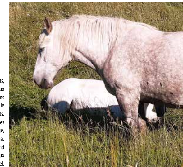
Chèvres, moutons, vaches, ânes et chevaux ont pris place dans le territoire, pour le bonheur des habitants. Rien qu'à Cholet, 13 sites sont en écopâturage, soit un total de 14 ha. Une solution qui répond parfaitement aux critères du label.