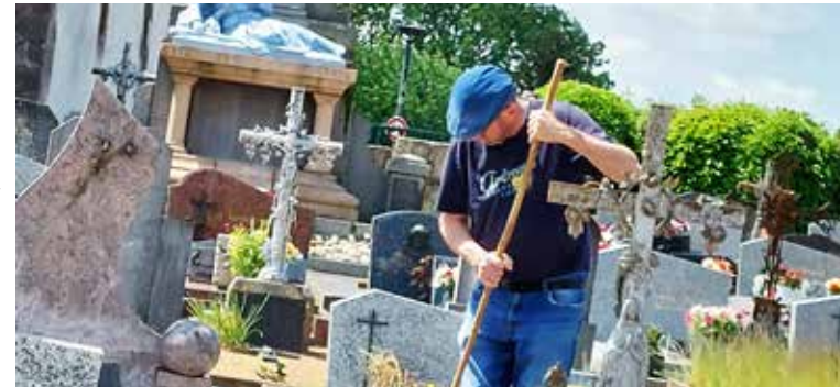
Arrachage des mauvaises herbes, nettoyage des espaces intertombeaux, reprofilage des allées, etc. À La Séguinière, une fidèle équipe de bénévoles participe à l'entretien du cimetière, où l'utilisation de produits phytosanitaires est interdite.