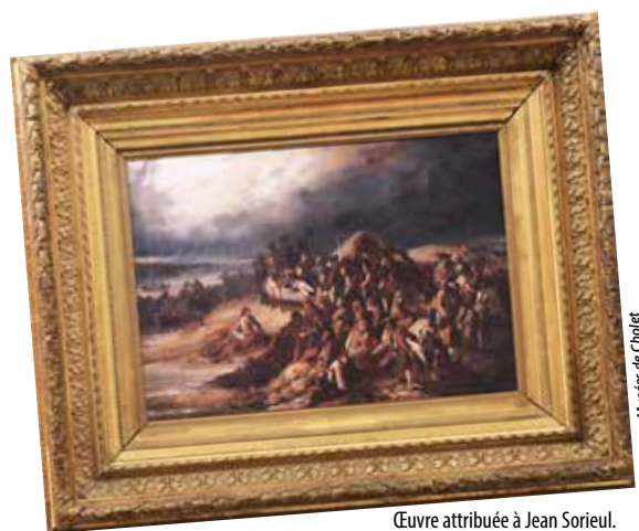
Œuvre attribuée à Jean Sorieul. Passage de la Loire (1848).