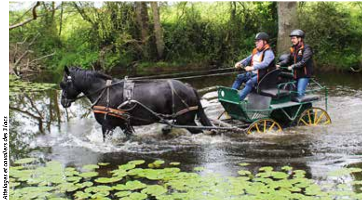
Attelage et cavaliers des 3 lacs

Que vous soyez marcheur, cavalier ou meneur d'une calèche, la randonnée de l'association Attelage et cavaliers des 3 lacs vous réunit !