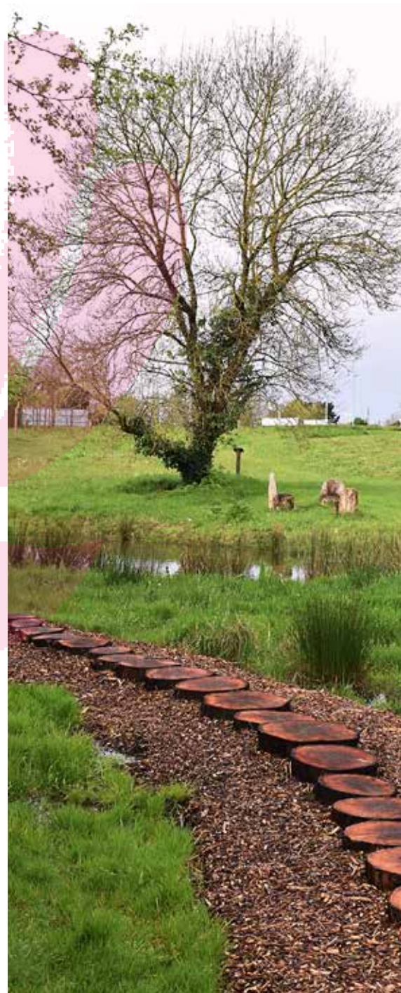
À Nuaille, l'espace humide, situé à l'entrée du bourg, a été restauré. Cette zone tampon filtre et, en période de sécheresse, restitue naturellement l'eau au ruisseau. Un panneau donne des explications sur son importance ainsi que sur la faune et la flore qui s'y développent.

« Nous sommes un petit groupe de trois à quatre personnes, en partie des professionnels du secteur, et nous visitons entre quatre et cinq communes dans la journée. Chaque visite dure une heure top chrono. Nous tenons compte d'éléments tels que la mise en place de la gestion différenciée, la strate arbustive et arborée, la pollution visuelle, l'économie des ressources, la réutilisation du bois de coupe pour le paillage, la préservation des arbres, la participation des citoyens, la communication autour du label, etc. Il est aussi important que le jury retrouve une cohérence entre le discours et les actions, mais aussi un travail d'équipe entre élus et agents de terrain. Le fleurissement ne représente plus qu'une petite partie des nombreux critères évalués. Le jury peut aussi remettre des prix spéciaux : celui de la mise en valeur du patrimoine, du jardinier, de l'arbre, etc. Dans tous les cas, notre passage est l'occasion de donner des pistes : nous précisons les éléments qui ont vraiment plu, les progrès à accomplir et nos attentes pour les prochaines visites. D'ailleurs, j'encourage les autres communes de Cholet Agglomération à candidater. Avant de se lancer, je peux venir les conseiller. »