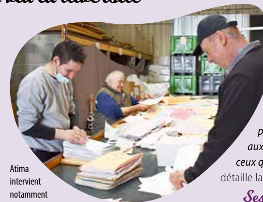
Atima intervient notamment pour le tri, la collecte et le conditionnement de papier et carton.