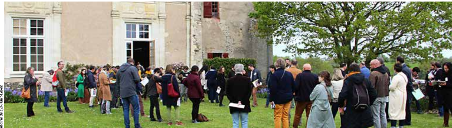
Le séminaire, réunissant différentes collectivités, s'est tenu au château Maupassant.

Trois circuits de découverte ont été proposés, avec pour objectifs de présenter les actions menées par la Collectivité en matière de nature en ville mais aussi d'échanger avec les participants sur les pistes d'amélioration et les actions à conforter sur le territoire pour faciliter et mieux intégrer la végétalisation dans les centres-bourgs.