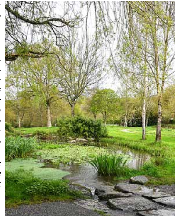
Le site du Moulin de la Cour, en bordure de la Moine, à La Séguinière, offre un espace de grande qualité qui renforce les trames vertes et bleues, visant à maintenir et à reconstituer un réseau d'échanges pour les espèces animales et végétales.

Au regard des exigences de la labellisation, c'est donc bien un ensemble de mesures environnementales qui est reconnu et récompensé, en reconnaissance des actions portant sur la biodiversité, la gestion différenciée des espaces verts, leur traitement sans produits phytosanitaires, l'identification et la valorisation du patrimoine végétal et bien d'autres actions. Si à Cholet, les parcs de Moine, du Menhir, de Moine, Turpault ou encore le jardin du Mail sont de véritables poumons