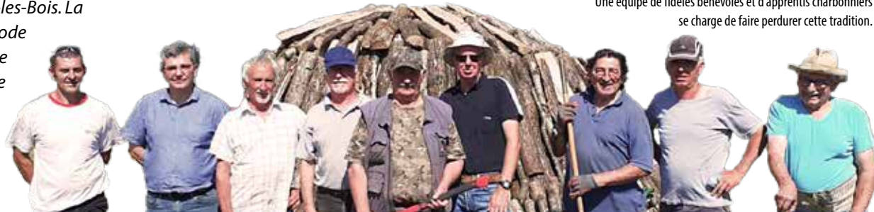
Comité des fêtes de Chanteloup-les-Bois

Une équipe de fidèles bénévoles et d'apprentis charbonniers se charge de faire perdurer cette tradition.