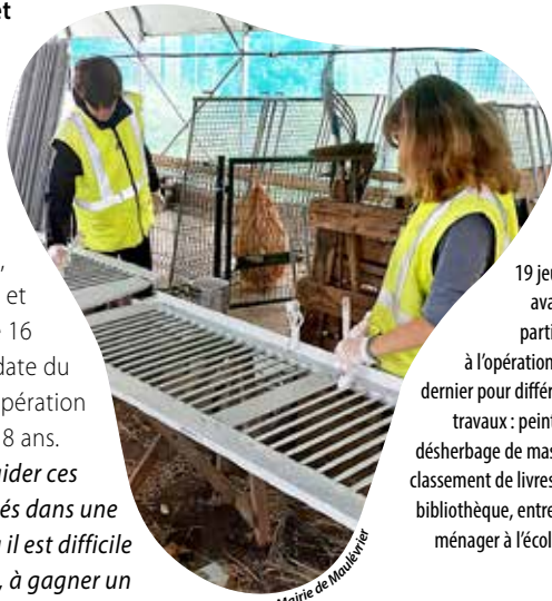
19 jeunes avaient participé à l'opération l'an dernier pour différents travaux : peinture, désherbage de massifs, classement de livres à la bibliothèque, entretien ménager à l'école...