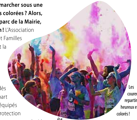
Les coureurs repartiront heureux et... colorés !

La soirée se poursuivra avec la fête de la musique locale, ouverte à tous et, nouveauté cette année, la possibilité de déguster un repas, sur réservation, en plus de la traditionnelle buvette.