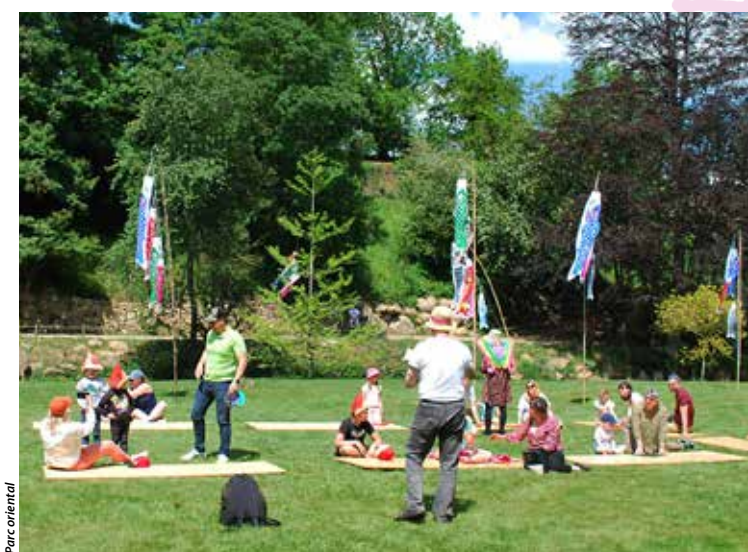
Kodomo no hi célèbre les enfants.

Symbolisant, au Japon, l'amour, le succès, le courage, la bonne croissance et la longévité, les carpes veilleront sur les enfants – sous forme de Koï nobori, des manches à air colorées – ces samedi 4 et dimanche 5 mai, au Parc oriental. On y célébrera Kodomo no hi, les journées des enfants, pendant lesquelles, traditionnellement, les parents souhaitent à leur progéniture bonheur, prospérité, joie et santé. Pour faire découvrir cette fête japonaise et offrir un moment de partage intergénérationnel aux visiteurs, le Parc oriental a donc concocté un programme alléchant ! Pendant les deux jours, seront