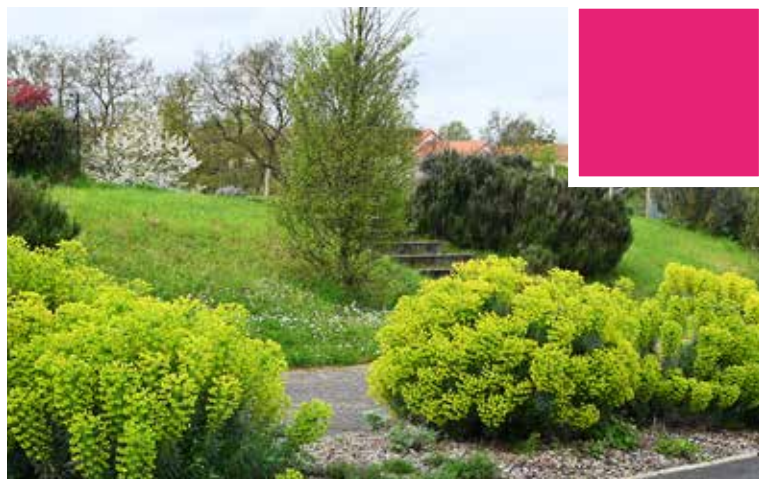
Au May-sur-Èvre, le nouveau lotissement de la Baronnerie sera aussi présenté au jury lors de son prochain passage. Le lotissement a obtenu le prix départemental de gestion durable.