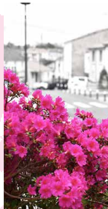
À La Tessoualle, l'arrosage se fait grâce à une citerne naturellement alimentée en eau. Celle-ci existe depuis plusieurs centaines d'années et servait au remplissage des camions de pompier. La commune a investi dans une citerne mobile avec pompage qui permet la récupération de cette eau pour l'arrosage des différentes plantations.

* fleurs ensuite renouvelées par confirmation tous les trois ans