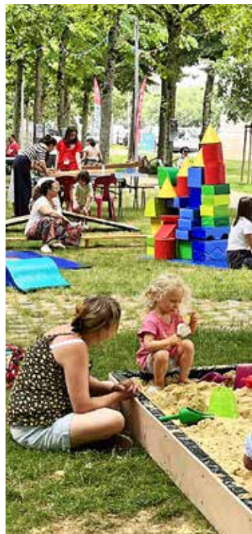
La journée champêtre clôture cette action, avec le plein d'animations.

De 9 h 30 à 10 h 30 Infos au 02 41 55 55 84