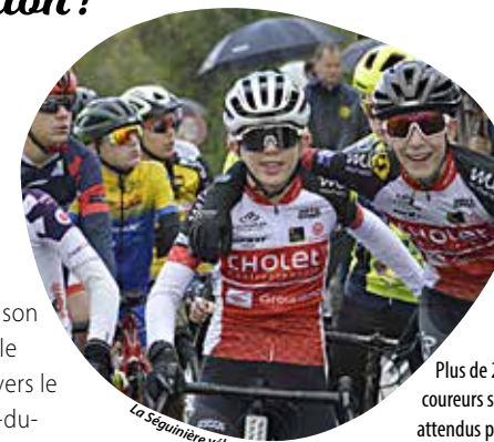
La Séguinière vélo sport

Plus de 200 coureurs sont attendus pour cette belle journée sportive, dont quelques Ziniérais très motivés pour s'illustrer sur leurs terres, dans les différentes catégories. Les coureurs Access s'élanceront à 10 h, pour dix tours de circuit et environ une heure et demie d'épreuve. Les U15 prendront le relais, à 13 h 30, pour une arrivée estimée une heure plus tard, après cinq tours. Enfin, les U17 clôtureront la