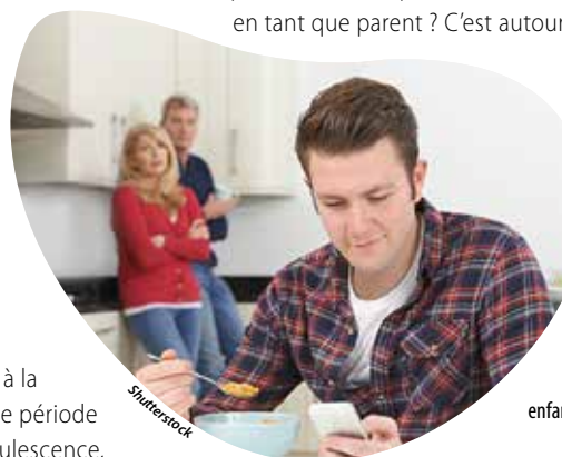
Les parents pourront s'interroger sur les relations avec leur grand enfant toujours à la maison...

Point info famille Pôle social - 3 e étage 24 avenue Maudet à Cholet Tél. : 02 72 77 22 10 info-famille@choletagglomeration.fr