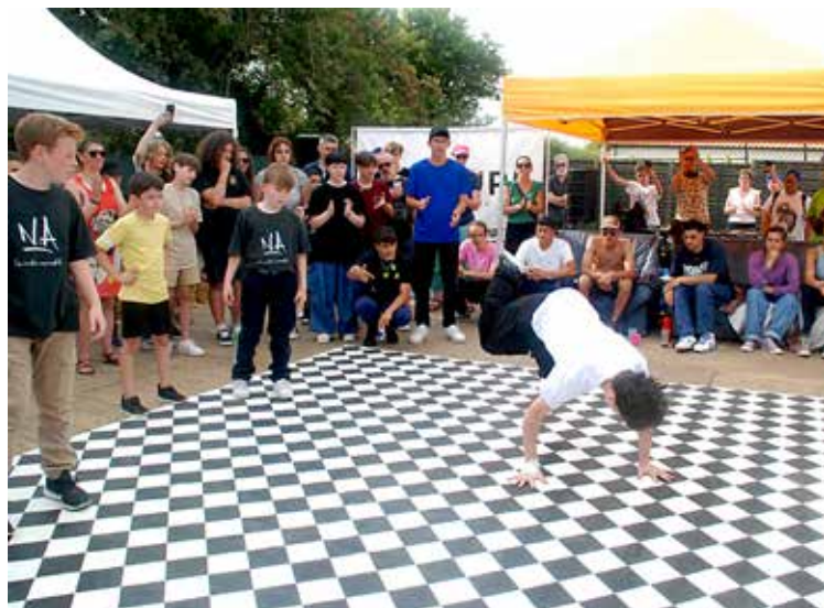
Plusieurs équipes du Grand Ouest se défieront lors de ce battle, se tenant le dimanche 5 mai.