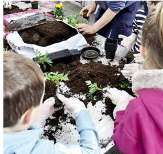
Les communes souhaitant décrocher le label doivent mener des actions de sensibilisation de la population. À Cholet, parmi les nombreuses animations proposées, la Fête de l'arbre, la Fête de l'automne et la Fête du printemps s'adressent plus particulièrement aux enfants.