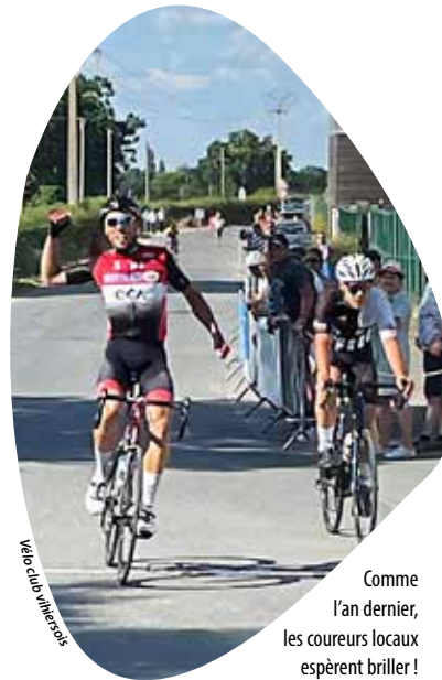
Vélo club vihiermois

Afin d'assurer la sécurité de tous, le comité des fêtes demande aux riverains qui auront besoin de se déplacer de circuler obligatoirement dans le sens de la course.