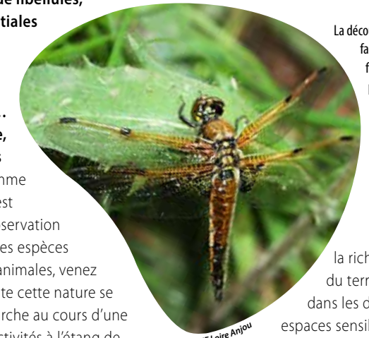
CPTE Loire Anjou

Le rendez-vous est donné ce samedi 11 mai, à 10 h, au parking de l'étang à Chanteloup-les-Bois, pour une animation de deux heures gratuite et tout public, pendant laquelle les participants parcourront 2 km. Cette sortie s'inscrit dans le cadre de la politique de préservation et de valorisation des milieux naturels de Cholet Agglomération, qui invite chacun à découvrir ou redécouvrir