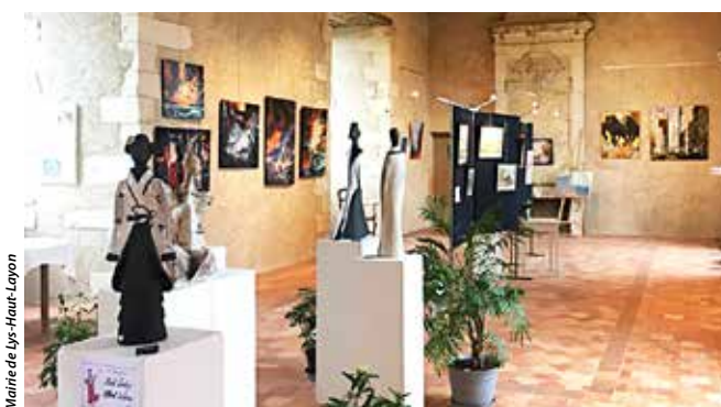
Pendant trois jours, le château de Maupassant met en valeur une trentaine d'artistes.

Avis aux amateurs d'art ou simples curieux, l'association Vihiers Patrimoine organise la 24 e édition de son Salon des arts. L'événement, qui se tient de ce vendredi 10 au dimanche 12 mai, de 14 h à 19 h, au château de Maupassant, réunit environ 200 œuvres, réalisées par une trentaine d'exposants. Sur les trois niveaux du château, seront présentées peintures,