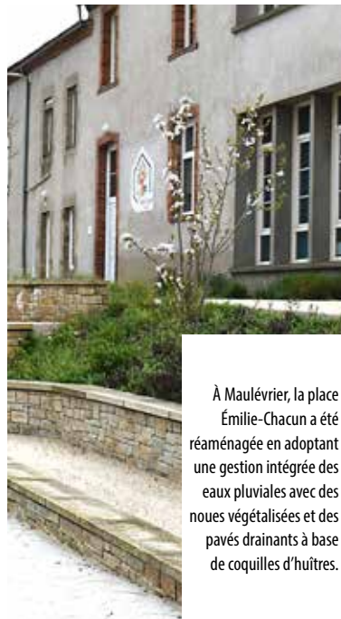
À Maulévrier, la place Émilie-Chacun a été réaménagée en adoptant une gestion intégrée des eaux pluviales avec des noues végétalisées et des pavés drainants à base de coquilles d'huîtres.