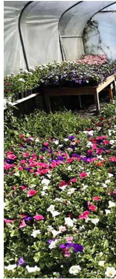
À La Plaine, la serre municipale permet de fleurir la commune tout l'été.