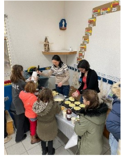
L'équipe de l'APEL

Ce marché viendra clôturer la semaine du festival du livre : les ouvrages seront consultables sur place et proposés à la vente.