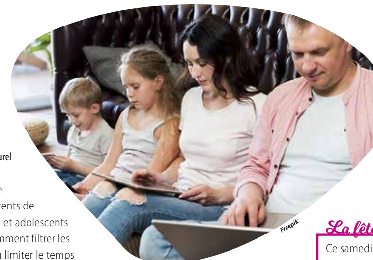
L'événement « Et si on regardait les écrans autrement ? » invite à mieux en comprendre les usages et les limiter.

Les parents d'adolescents de 12 ans et plus sont invités à se pencher sur les pratiques de leurs jeunes sur leur portable et à mieux connaître cet univers pour en parler avec eux.