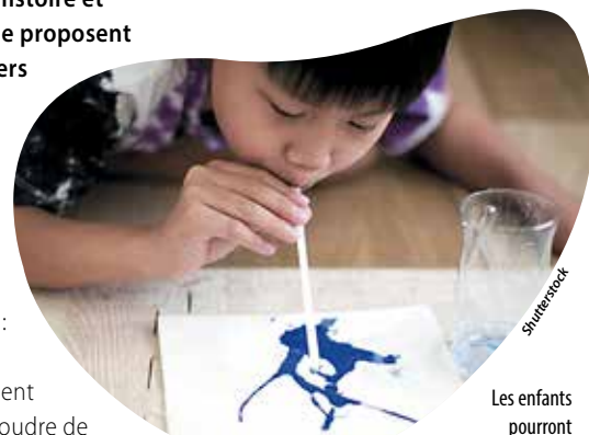
Les enfants pourront peindre en utilisant l'eau et leur souffle.