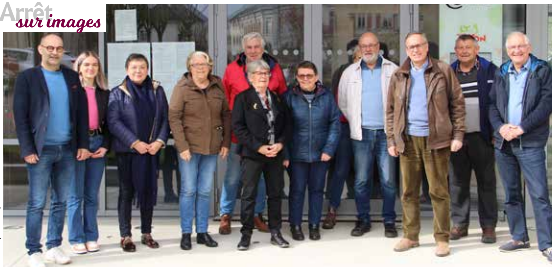
Mairie de Lys-Haut-Layon