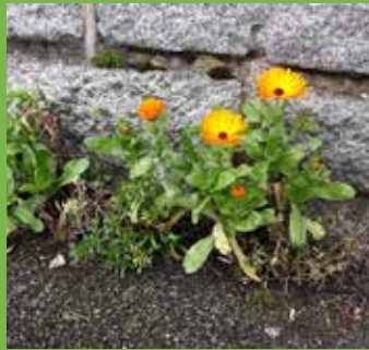
Il est possible de fleurir les pieds de mur avec des muilliers, giroflées et soucis.