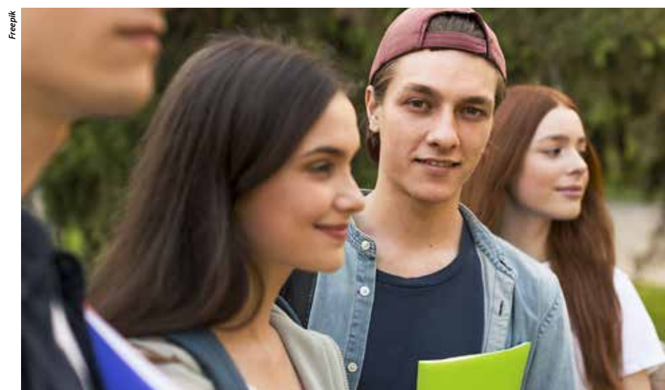
Les élèves de seconde et première sont invités à réfléchir sur leur avenir.

« son pouvoir d'agir » annoncent les psychologues de l'Éducation nationale qui animeront cet atelier. Ces derniers précisent : « Le monde fait face à des enjeux inédits (épousement des ressources, climat, santé...). Les révolutions technologiques s'accroissent (développement de l'IA...). Bref, le monde bouge et cela peut parfois inquiéter. Dans ces conditions, il n'est pas facile de réfléchir à son orientation