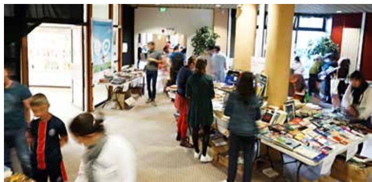
Médiathèque Élie Chamard

Les ouvrages proposés à la vente sont ceux qui ne sont plus empruntés, abîmés ou obsolètes, car remplacés par une édition plus récente.