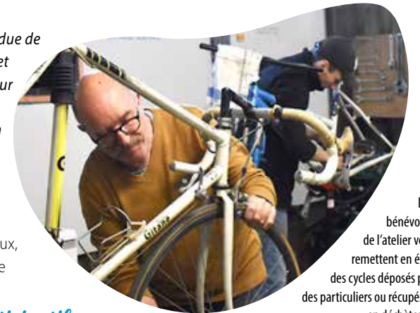
Les bénévoles de l'atelier vélo remettent en état des cycles déposés par des particuliers ou récupérés en déchèterie.

Pour rappel, l'atelier vélo est ouvert les mercredis et samedis, de 9 h 30 à 12 h et de 14 h à 17 h 30, ainsi que les vendredis, de 14 h à 17 h 30. Se voulant participatif, il permet aussi à chacun, sous couvert d'une adhésion, de venir apprendre à faire de menues réparations sur son vélo aux côtés des bénévoles avertis.