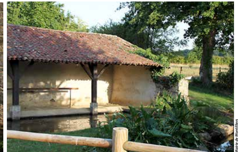
... de même que le lavoir, au lieu-dit la Fontaine, qui nous ramène au temps des « bergeronnettes », ces lavandières amenant leur linge dans des brouettes.