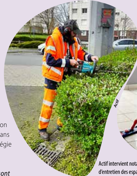
Actif intervient notamment pour des activités d'entretien des espaces verts ou de locaux.

Créées dans les années quatre-vingt de la volonté d'habitants de participer à l'amélioration de leur cadre de vie, les régies de quartier se sont très vite articulées autour de trois missions : l'embauche des femmes et des hommes des quartiers prioritaires justement, l'accompagnement professionnel et les actions de lien social. À Cholet, Actif – pour Association création travail insertion formation – s'inscrit pleinement dans cette démarche, depuis 1985. La régie de quartier accueille aujourd'hui 46 salariés en insertion, avec une moyenne d'âge de 41,5 ans. « Ce sont des publics qui n'ont pas travaillé depuis très longtemps, à la santé physique ou mentale souvent fragile. Pour beaucoup, il existe aussi des freins : la langue, la mobilité, la garde des enfants... Nous leur remettons le pied à l'étrier, en les ramenant vers l'emploi, avec des contrats d'objectifs réguliers. En fonction des besoins, les horaires peuvent varier de 20 heures à 30 heures par semaine, présente Valérie Charrieau, la directrice. Nous apprenons à apprécier chaque petite victoire au fil des mois : retrouver un logement, reprendre confiance en soi, décrocher un poste de droit