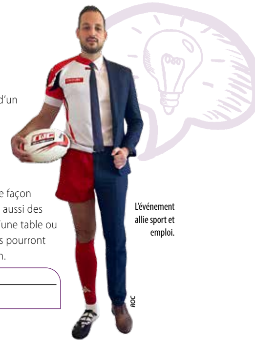
L'évènement allie sport et emploi.