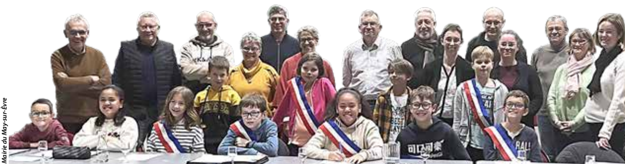
Maire du May-sur-Èvre

Le samedi 13 avril, de 9 h   12 h,   l'Exeko, place   la cr ativit , au partage de connaissances et au recyclage, avec un atelier couture organis  par des b n voles. D butants comme confirm s sont invit s   venir, munis de tissus et de fils, afin de s'initier, faire part de ses connaissances et astuces, apprendre de nouvelles techniques et r aliser des projets cr atifs en toute convivialit .