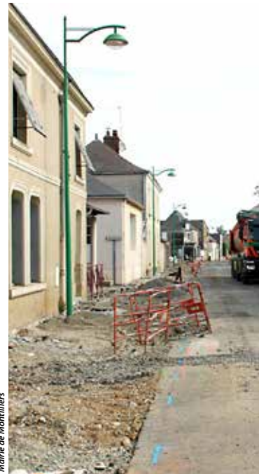
Mairie de Montilliers

Ci-dessous, l'avant/après travaux de la traversée du bourg, le long de la D748. Après la phase de chantier, qui a perturbé la circulation et les habitudes de chacun, l'inauguration ouverte à tous les Montglésiens est annoncée.