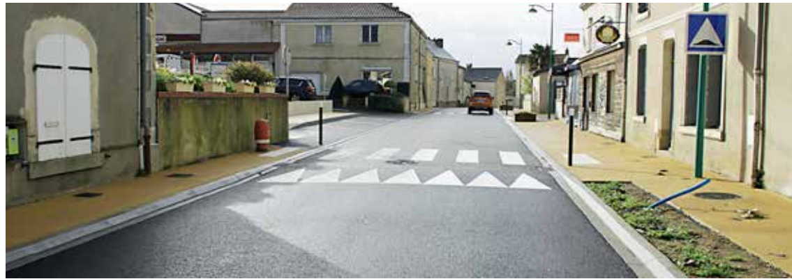
Mairie de Montilliers

Après plusieurs mois de travaux, la traversée de la commune est désormais conforme et sécurisée. Le chantier, qui s'est déroulé de la mi-mai à la fin septembre 2023, visait à sécuriser la population impactée par la circulation routière, avec un passage de 3 500 véhicules par jour, dont 285 poids lourds. Pour ce faire, la largeur de la chaussée a été réduite à 5,50 m et la vitesse abaissée à 30 km/h. De plus, différentes installations, telles que des