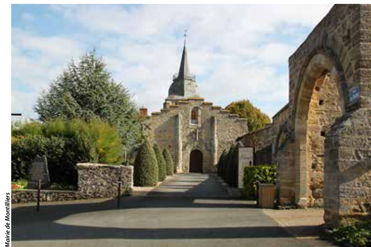
L'histoire du prieuré, construit au XI e siècle et converti en EHPAD, est l'un des éléments du patrimoine faisant l'objet d'un panneau signalétique...

Cette idée, en projet depuis 2020, a été rendue possible grâce à la Municipalité qui finance l'intégralité de la réalisation de ces supports, dont la mise en place sera assurée par les agents municipaux. Les promeneurs n'ont plus qu'à se saisir de cette invitation pour mieux connaître le patrimoine de cette commune, à travers sept éléments, dont la liste n'est pas exhaustive. « Nous aurions pu en faire davantage encore, car il y a à Montilliers beaucoup d'anciennes fermes et de calvaires » souligne Renée Beaumont. Peut-être feront-ils l'objet d'un futur projet.