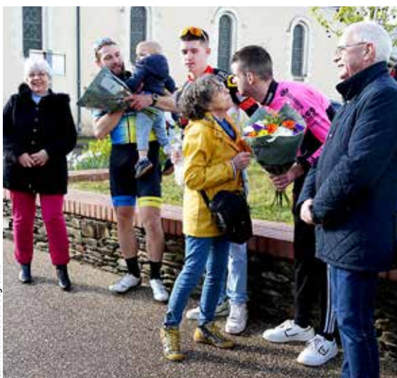
Comité animations bégrollais

Fidèle à la coutume locale, le Comité animations bégrollais a organisé sa fête des œufs durs, en ce week-end pascal. Après le vide-greniers et le marché de créateurs, où la pluie était malheureusement de la partie, les courses de trottinettes pour les jeunes enfants, puis les courses cyclistes sont venues animer ce week-end. Au programme : les épreuves des U15 et U17, puis celles des différentes catégories adultes, qui ont effectué plusieurs tours de circuit, entre bourg et campagne.