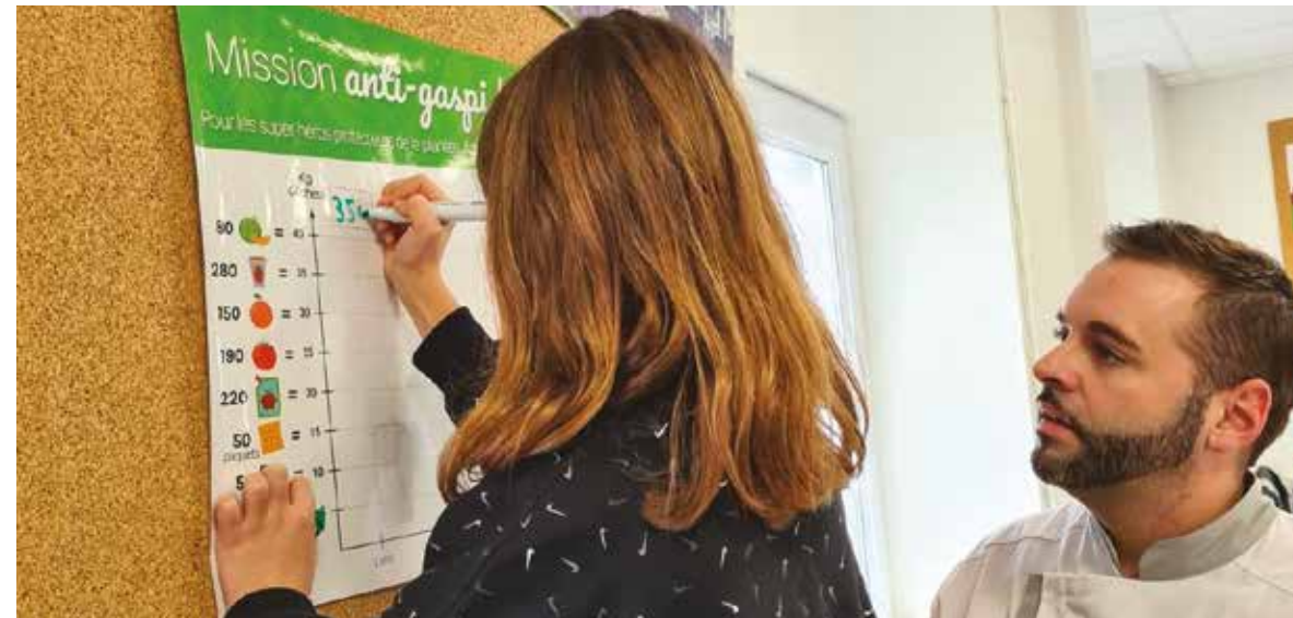
Le diagnostic du gaspillage alimentaire implique pleinement les enfants qui, chaque jour, font la pesée des restes des assiettes, sous le regard attentif du chef cuisinier.