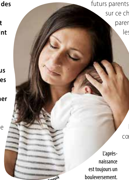
L'après-naissance est toujours un bouleversement.

donnera des conseils pratiques aux futurs parents, pour les guider sur ce cheminement du parent en devenir. Elle les aidera à lever les tabous pour repartir vers le mois d'or du post-partum (les 30 à 40 jours qui suivent l'accouchement et demandent le repos) avec le cœur plus léger.