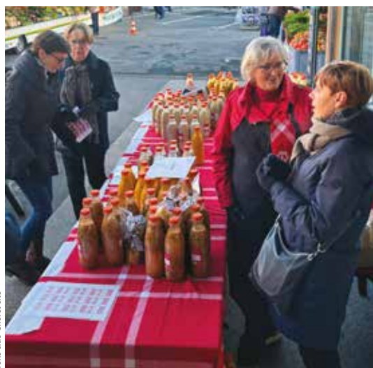
Lions club Cholet cité