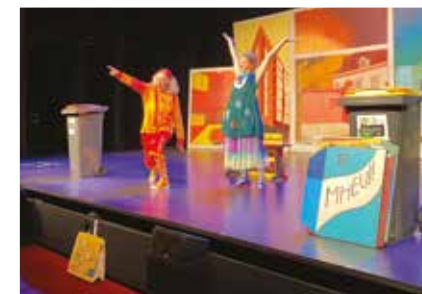
Direction de l'Environnement - Cholet Agglomération