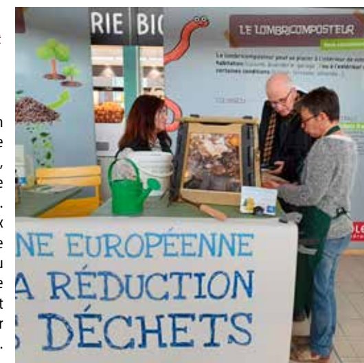
Direction de l'Environnement - Cholet Agglomération

Dans le cadre de la Semaine européenne de réduction des déchets, Cholet Agglomération, sensible à cette thématique depuis de nombreuses années, a choisi, pour cette édition, de mettre l'accent sur le gaspillage alimentaire, le tri et la valorisation des biodéchets. La Collectivité a notamment installé des stands aux halles de Cholet, afin d'apporter de l'information de proximité lors de deux matinées à la rencontre du public. De nombreuses personnes ont ainsi pu venir se renseigner sur le compostage, le lombricompostage et les solutions pour valoriser les biodéchets et démêler le vrai du faux de ces techniques (lire aussi p. 6).