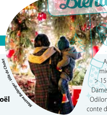
Ville de Cholet

Anjou avec vin, bougies, miel, confitures, etc. > 15 h 30, à l'église Notre-Dame, concert de l'abbé Odilon suivi, à 16 h 30, d'un conte de Noël et, à 17 h, de la chorale des jeunes enchantés, Infos : mdo.cholet@wanadoo.fr ou 02 41 46 07 54 ou www.choletcatho.net