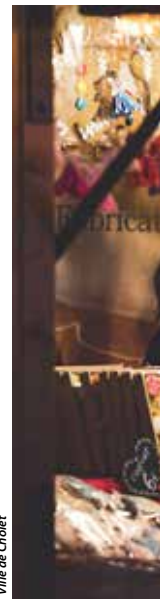
Ville de Cholet

Organisé par la Municipalité avec le concours du comité des fêtes, le marché de Noël s'installe place Grignon-de-Montfort, ce dimanche 10 décembre, de 15 h à 19 h. « La nouveauté porte essentiellement sur l'emplacement, que nous souhaitons tester cette année pour faire vivre et mettre en valeur les récents aménagements du centre-bourg »