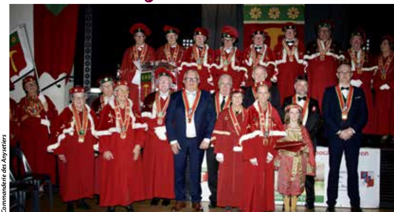
Commanderie des Anysetiers

Samedi 18 novembre - Le Puy-Saint-Bonnet