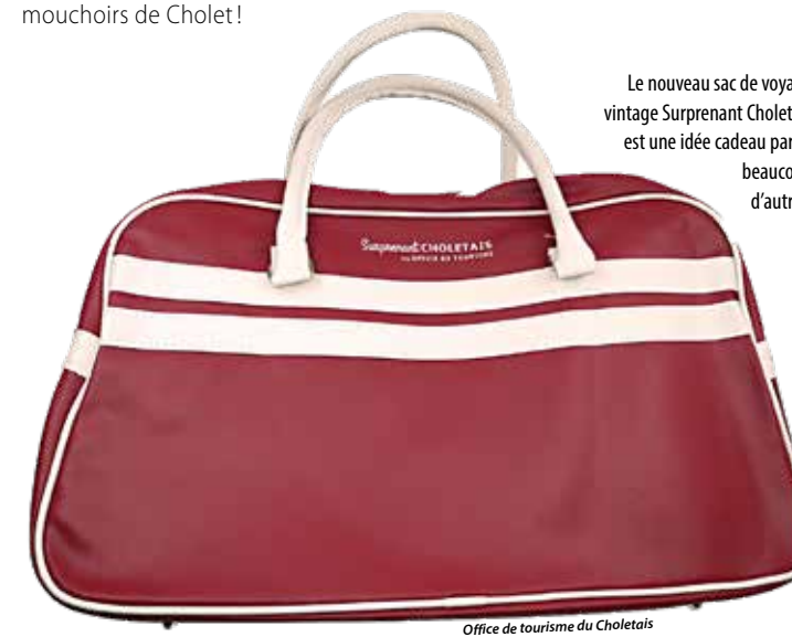
Le nouveau sac de voyage vintage Surprenant Choletais est une idée cadeau parmi beaucoup d'autres.

Infos : • Office de tourisme du Choletais 14 avenue Maudet à Cholet • Bureau d'information touristique 14 rue Monnaie à Lys-Haut-Layon/Vihiers Tél. : 02 41 49 80 00 www.ot-cholet.fr