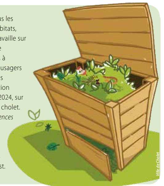
Ville de Cholet

Mais pour répondre à tous les besoins des différents habitats, Cholet Agglomération travaille sur une étude permettant de répondre aux obligations à venir et aux attentes des usagers en matière de gestion des biodéchets. L'agglomération communiquera courant 2024, sur les évolutions à venir, via cholet.fr ou encore dans Synergences hebdo. En attendant, retrouvez dans les prochains numéros les réponses à d'autres idées reçues autour du compost.