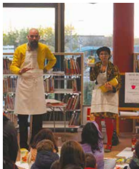
Médiathèque Élie Chamard

Après l'exposition éphémère Les interprétations tactiles et une conférence sur la dyslexie, c'est un spectacle familial qui conclut la Semaine édition jeunesse accessible, dans le réseau des bibliothèques de Cholet Agglomération. À la médiathèque Élie Chamard, 55 adultes et enfants, âgés de quelques mois à une dizaine d'années, ont assisté à la représentation Demaiselle(s) en carreaux de pois , de 10 Doigts compagnie : une sensibilisation burlesque à la langue des signes.