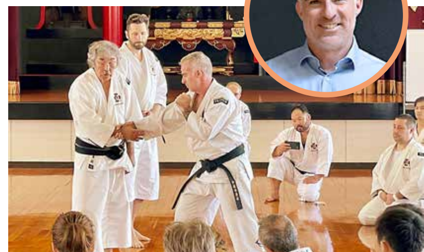
Cholet shorinji kempo