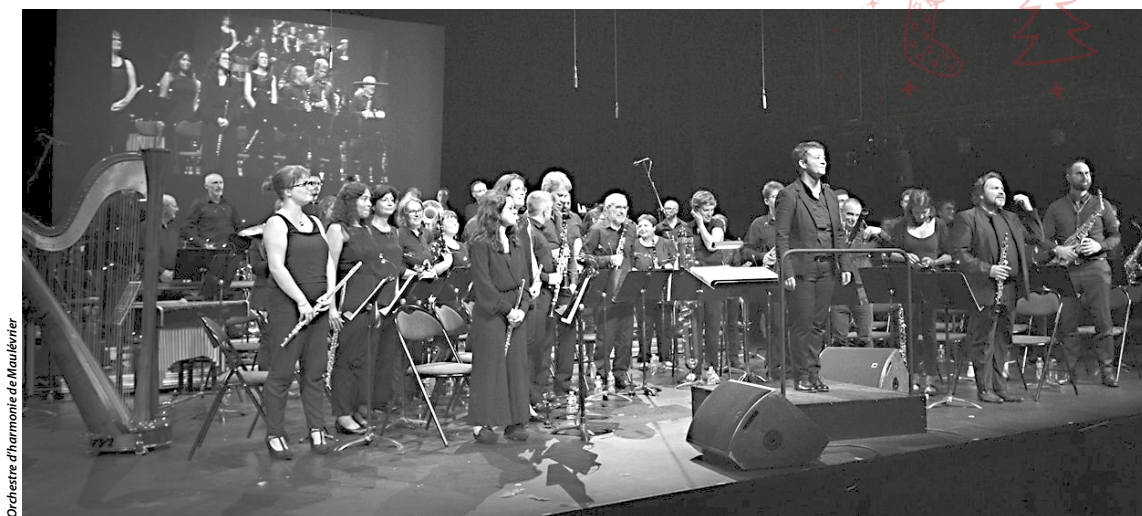
Orchestre d'harmonie de Maulévrier