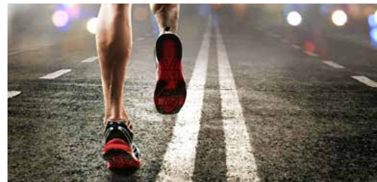
Cette sortie nocturne prendra des couleurs urbaines.

Équipés d'une lampe torche ou frontale et encadrés par les éducateurs sportifs municipaux, les participants pourront s'élançer dans les rues de Cholet, pour une expérience amusante et insolite, permettant d'explorer de nouvelles sensations. Un défi physique accessible à tous les niveaux, puisqu'il est aussi réalisable en marchant ! Et dans la bonne humeur pour tous !