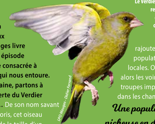
Le Verdier d'Europe se reconnaît à ses couleurs vert olive et jaune vif.

Pendant la saison froide, autour des mangeoires, on peut voir de nombreuses espèces d'oiseaux. Certains y viennent seuls comme le rouge-gorge, l'accenteur mouchet, ou en petit nombre comme les mésanges. Le verdier évolue souvent en petite troupe d'une dizaine d'individus et accapare régulièrement les postes de nourrissage car il est assez agressif vis-à-vis des autres oiseaux. En hiver, la population augmente car des migrateurs venus du nord se