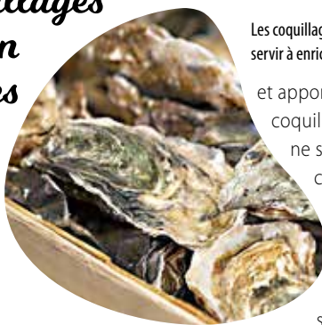
Les coquillages recyclés pourront servir à enrichir les sols.

Tout ce mois de décembre et de janvier, faute de plage abandonnée, coquillages et crustacés vont en déchèteries ! Si les fêtes de fin d'année sont une période où la consommation d'huîtres et de crustacés est importante, une solution permet de ne pas encombrer nos poubelles avec les coquillages vides. Cholet Agglomération invite les habitants à venir les déposer dans toutes les déchèteries et éco-points du territoire, où une benne est mise à disposition jusqu'au 31 janvier. Les usagers qui le souhaitent peuvent se stationner à l'extérieur de la déchèterie