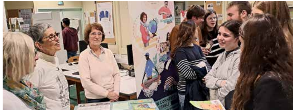
En autonomie, les élèves de l'atelier Premier campus ont mené leur première organisation propre, le jeudi 23 novembre dernier. Leur forum des associations réunissait sept structures qu'ils ont fait connaître aux autres jeunes du lycée.

Depuis l'an passé, le lycée Europe bénéficie d'une convention d'éducation prioritaire avec Sciences Po Paris, destinée aux élèves méritants de milieu modeste.