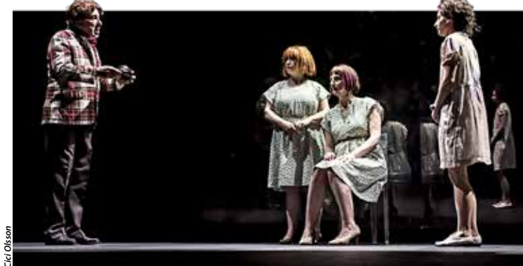
Cendrillon est une reprise de la création théâtrale de Joël Pommerat de 2011.

Le théâtre est à l'honneur en ce mois de décembre, au théâtre Saint-Louis, avec deux créations présentées : Cendrillon et Demain la revanche .