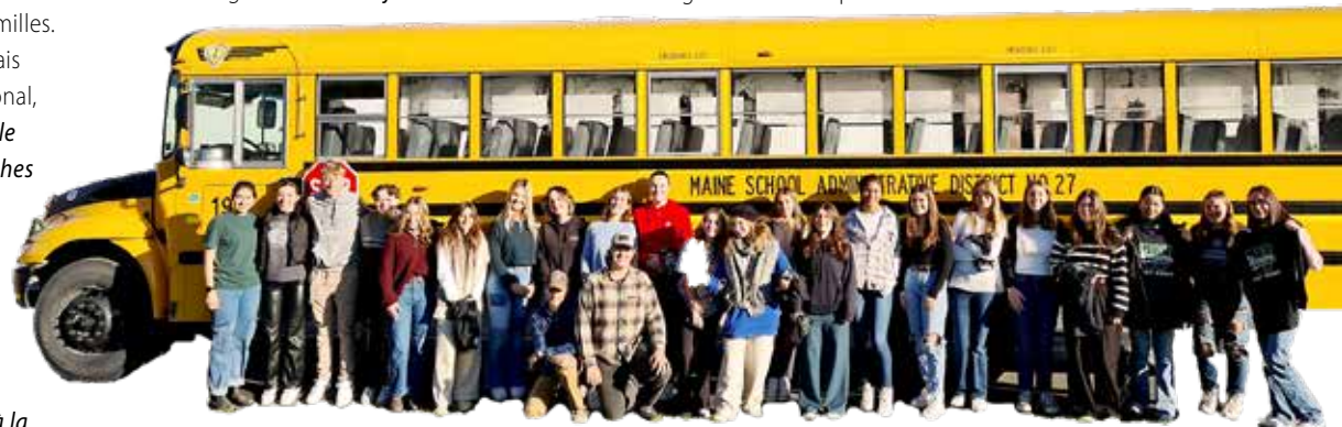
Les 12 élèves français posent ici avec leurs correspondants, devant un authentique bus scolaire américain, à l'occasion de leur voyage outre-Atlantique. En dix ans d'échange, 120 jeunes ont eu la chance de vivre ce séjour entre États-Unis et Canada.

tout à fait comme la nôtre, « qui ressemble à un patois de notre région ». Pas de quoi empêcher les échanges et les moments de partage comme Thanksgiving, les élèves ayant profité des mets traditionnels préparés pour cette fête. Sur le chemin du retour, la visite des villes de Montréal et Québec, déjà illuminées pour Noël et sous la neige, a terminé de donner une atmosphère féérique à ce voyage.