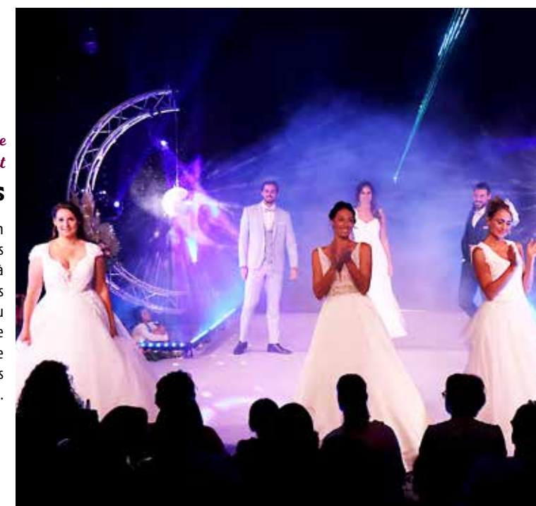
Cholet sport loisirs

Rassemblant plus de 60 professionnels, le salon du mariage et de la fête a accueilli 1 500 visiteurs durant ces deux jours consacrés non seulement à l'union des couples, mais également aux réunions de familles. Moments toujours très attendus du salon, les défilés en tenue de cérémonie ont, une fois encore, ravi le public, qui profitait cette année d'un hall supplémentaire pour apprécier les mises en scène dans les différents stands.