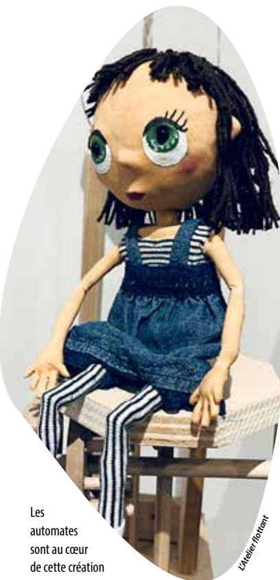
Les automates sont au cœur de cette création jeune public.