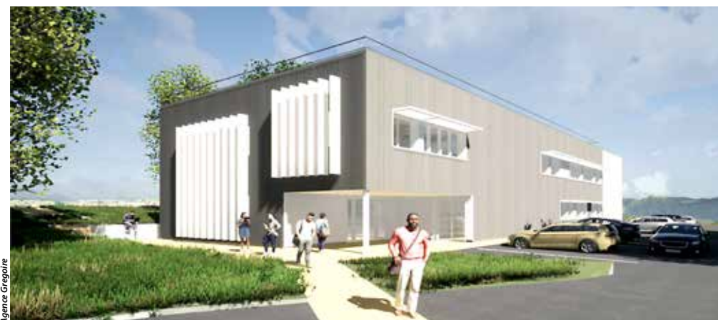
Le nouveau bâtiment se situera sur une partie du parking du domaine universitaire. Les travaux de construction seront achevés l'été prochain.