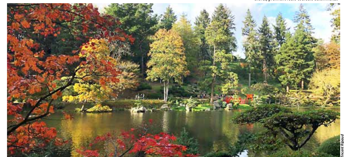
Le kōyō désigne, au Japon, la période où les arbres, prennent leurs couleurs automnales.

jusqu'au mercredi 15 novembre, date de sa fermeture, le jardin maulévrais entre dans sa période kōyō. Au Japon, il s'agit du changement de couleur des feuilles, en particulier celles de l'éraable momiji ou du ginkgo. La coutume nommée momijigari consiste à venir se promener dans les jardins pour apprécier la beauté des arbres et leur palette de couleurs alliant le rouge, le jaune et le vert.