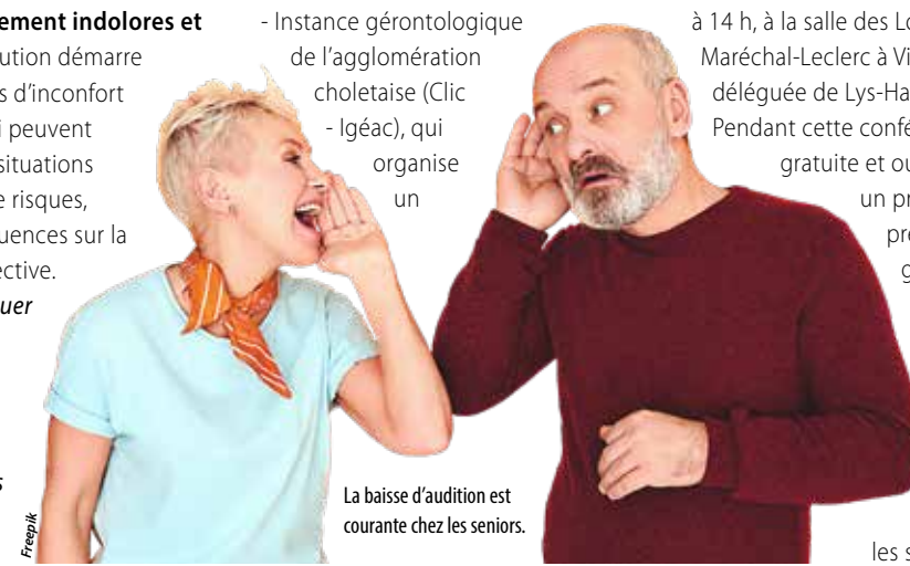
La baisse d'audition est courante chez les seniors.

et par soi-même » rappelle le Centre local d'information et de coordination - Instance gérontologique de l'agglomération choletaise (Clic - Igéac), qui organise un