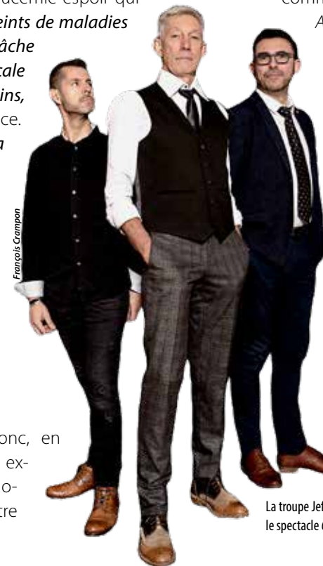
La troupe Jef présentera le spectacle Ces gens-là.

L'association s'engage donc, en organisant un concert exceptionnel, le samedi 4 novembre, à 20 h 30, au théâtre Saint-Louis.