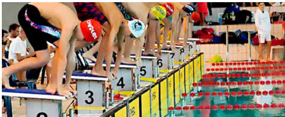
Les épreuves concernent les nageurs à partir de la catégorie benjamins (12 ans).