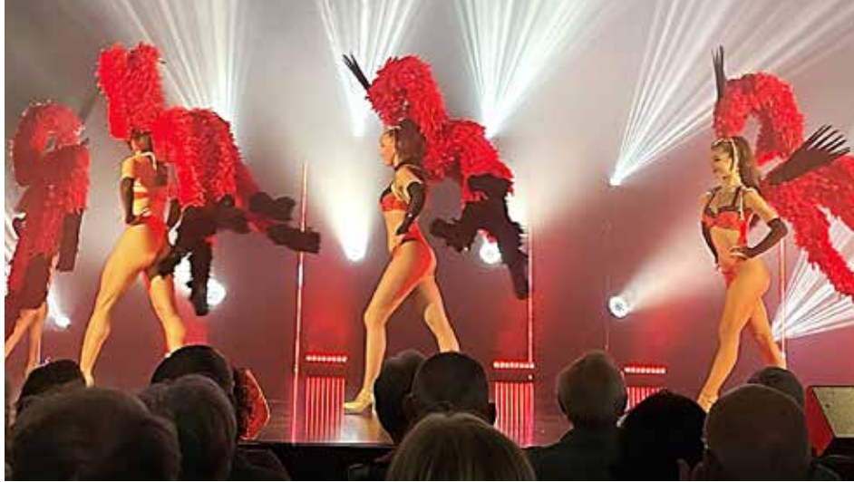
Comité des fêtes

Les amoureux de vinyles et collectionneurs de disques étaient au rendez-vous de la foire aux disques. Réunissant une bonne dizaine d'exposants, cette manifestation de la médiathèque de Cholet attire régulièrement plus de 500 visiteurs, en quête de l'exemplaire qu'ils recherchent depuis si longtemps pour beaucoup.