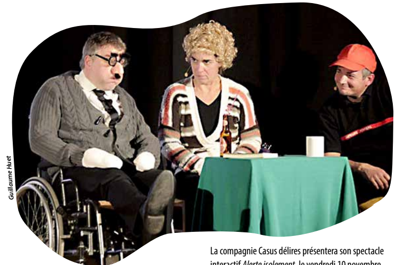
La compagnie Casus délires présentera son spectacle interactif Alerte isolement , le vendredi 10 novembre.