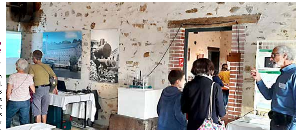
Musée du Textile et de la Mode

Le musée du Textile et de la Mode s'est mué en village des sciences le temps d'un week-end, accueillant différentes associations et stands à l'occasion de la fête de la science. Entre les mathématiques, le sport, l'astronomie ou l'eau et les économies d'énergie, les amateurs d'énigmes et d'avancées scientifiques avaient de quoi nourrir leur soif d'apprendre et de comprendre.