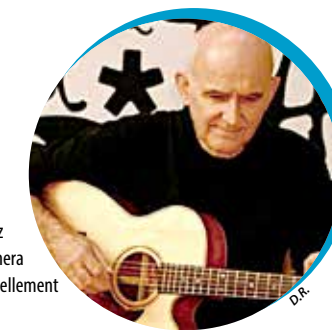
Dan Ar Braz accompagnera exceptionnellement la troupe.

La troupe Jef, l'orchestre Scenefonia et Dan Ar Braz ont répondu à l'invitation de l'association des clubs service du Choletais pour soutenir la lutte contre la maladie.