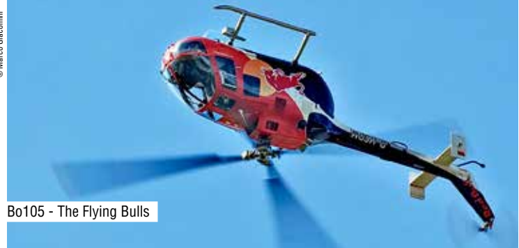
Bo105 - The Flying Bulls