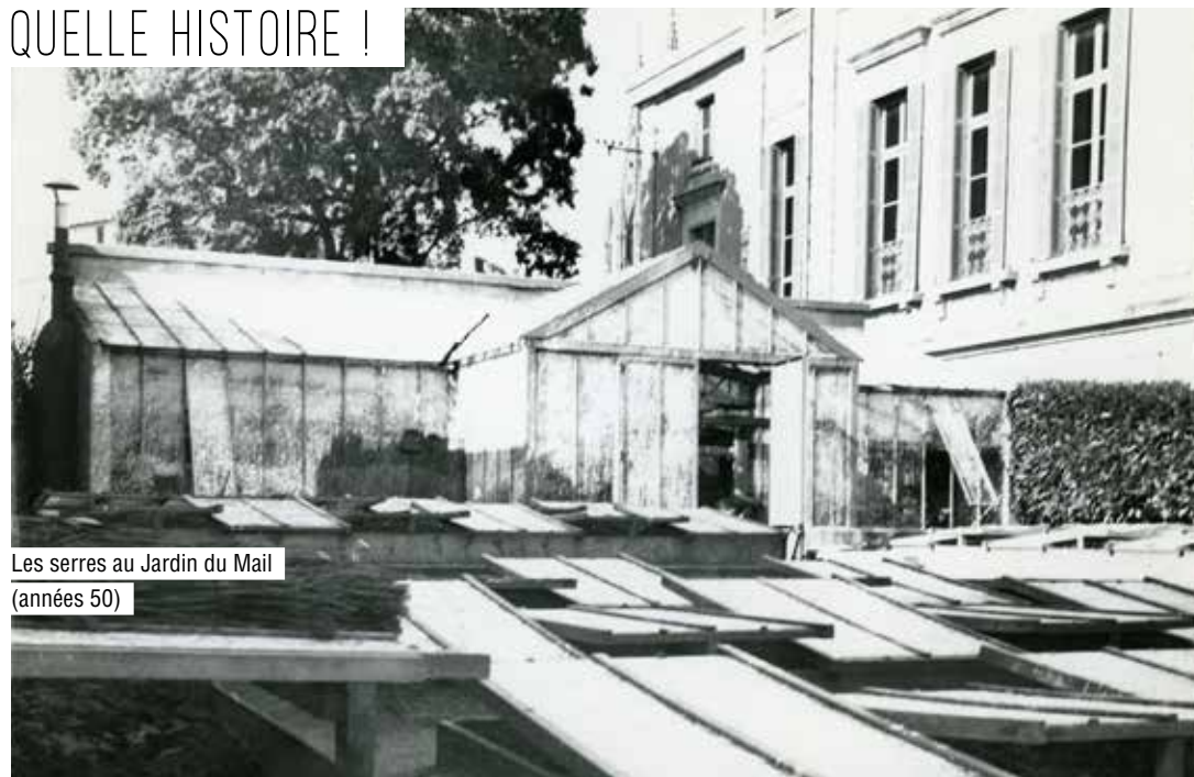
Les serres au Jardin du Mail (années 50)