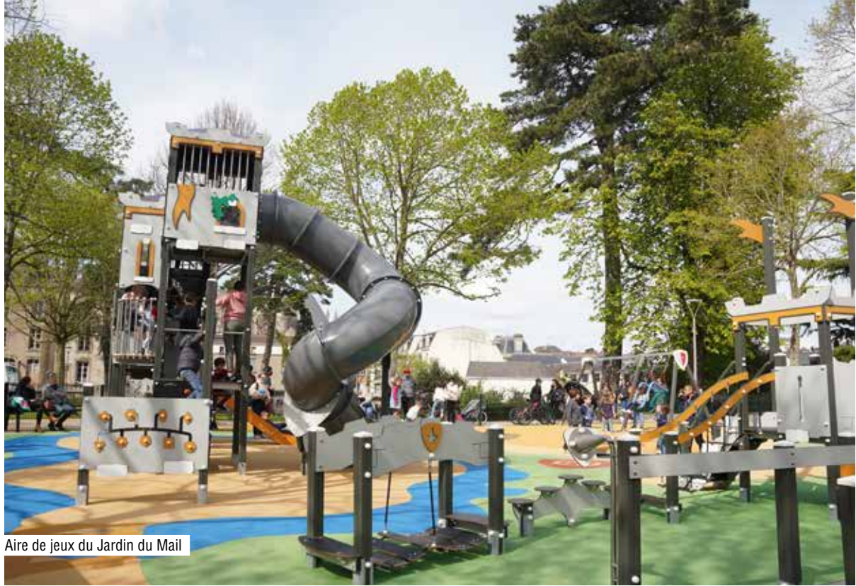
Aire de jeux du Jardin du Mail