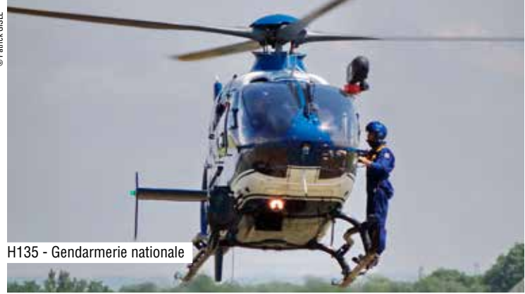
H135 - Gendarmerie nationale