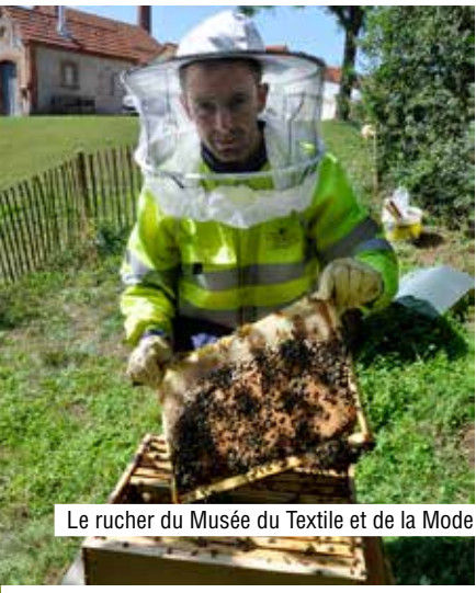
Le rucher du Musée du Textile et de la Mode