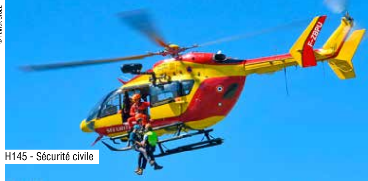
H145 - Sécurité civile