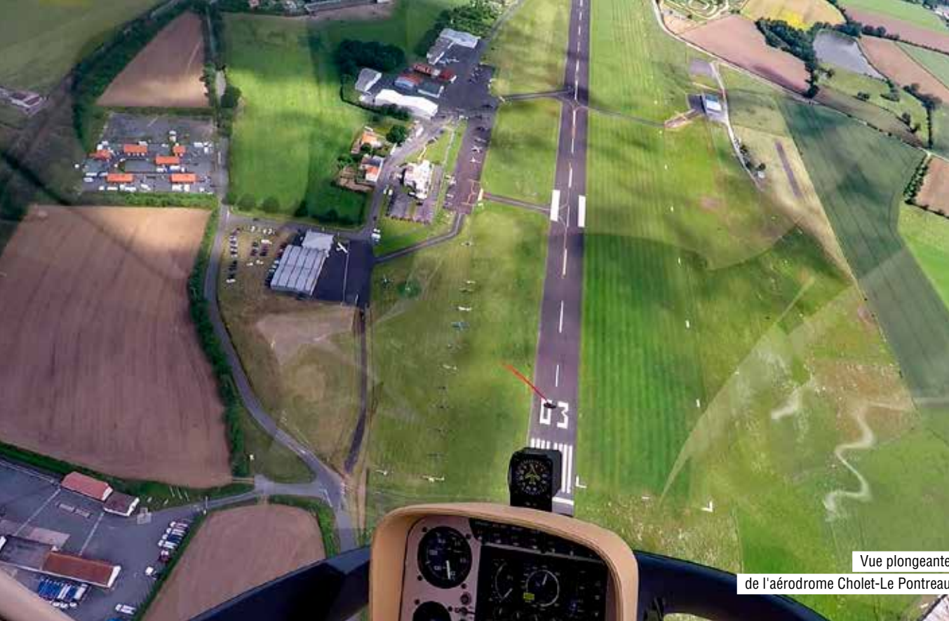
Vue plongeante de l'aérodrome Cholet-Le Pontreau

L'Héliclub de l'Ouest vous donne rendez-vous sur l'aérodrome du Pontreau dimanche 15 mai pour la 3 ème édition de son meeting 100 % dédié aux hélicoptères et autres appareils à rotor. Un évènement d'envergure ouvert au public pour la première fois. Entrée gratuite.