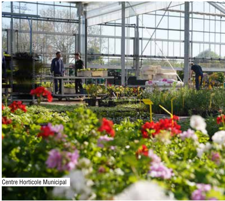
Centre Horticole Municipal