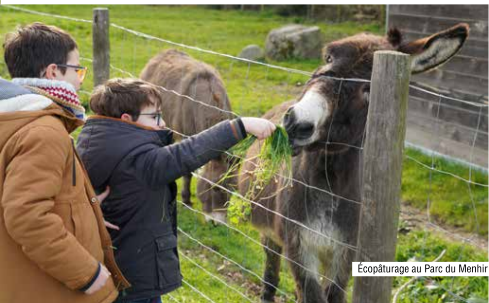
Écopâturage au Parc du Menhir