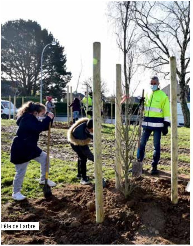
Fête de l'arbre

Outil de production livré en 2014, le Centre Horticole Municipal produit la totalité des plantes à massif utilisées pour orner les 2 960 m 2 de surfaces fleuries. Grâce à ses 6 000 m 2 de serres en verre, le Centre offre des locaux de production, des espaces techniques et des locaux administratifs pour les jardiniers et les horticulteurs de la Ville. Au total ce sont plus de 130 000 plantes à massif et 2 200 plantes vertes qui sont produites chaque année.