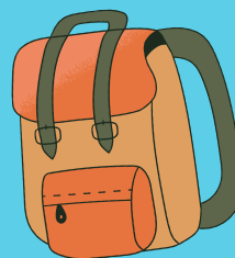
sac à dos