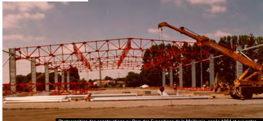
Photographies des constructions au Parc des Expositions de la Meilleraie, année 1984 et suivantes...