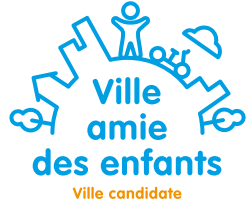
Cholet est Ville Amie des Enfants depuis 2004 et candidate à la reconduction du titre.

Centres sociaux... de nombreux services et partenaires de la Collectivité ont concocté un programme riche et varié d'animations "mystères", pour se laisser surprendre en famille. De quoi se déconnecter !