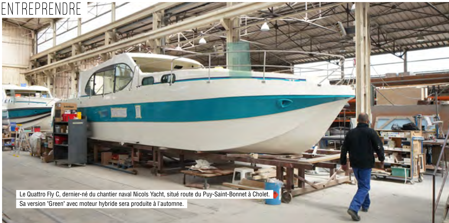
Le Quattro Fly C, dernier-né du chantier naval Nicols Yacht, situé route du Puy-Saint-Bonnet à Cholet. Sa version "Green" avec moteur hybride sera produite à l'automne.