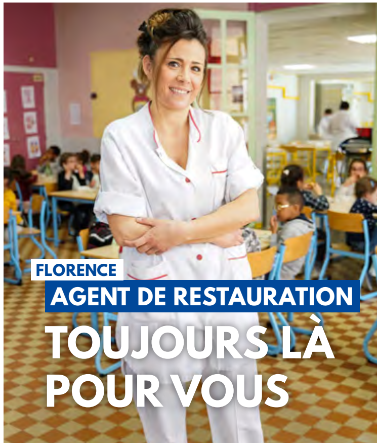
FLORENCE AGENT DE RESTAURATION TOUJOURS LÀ POUR VOUS