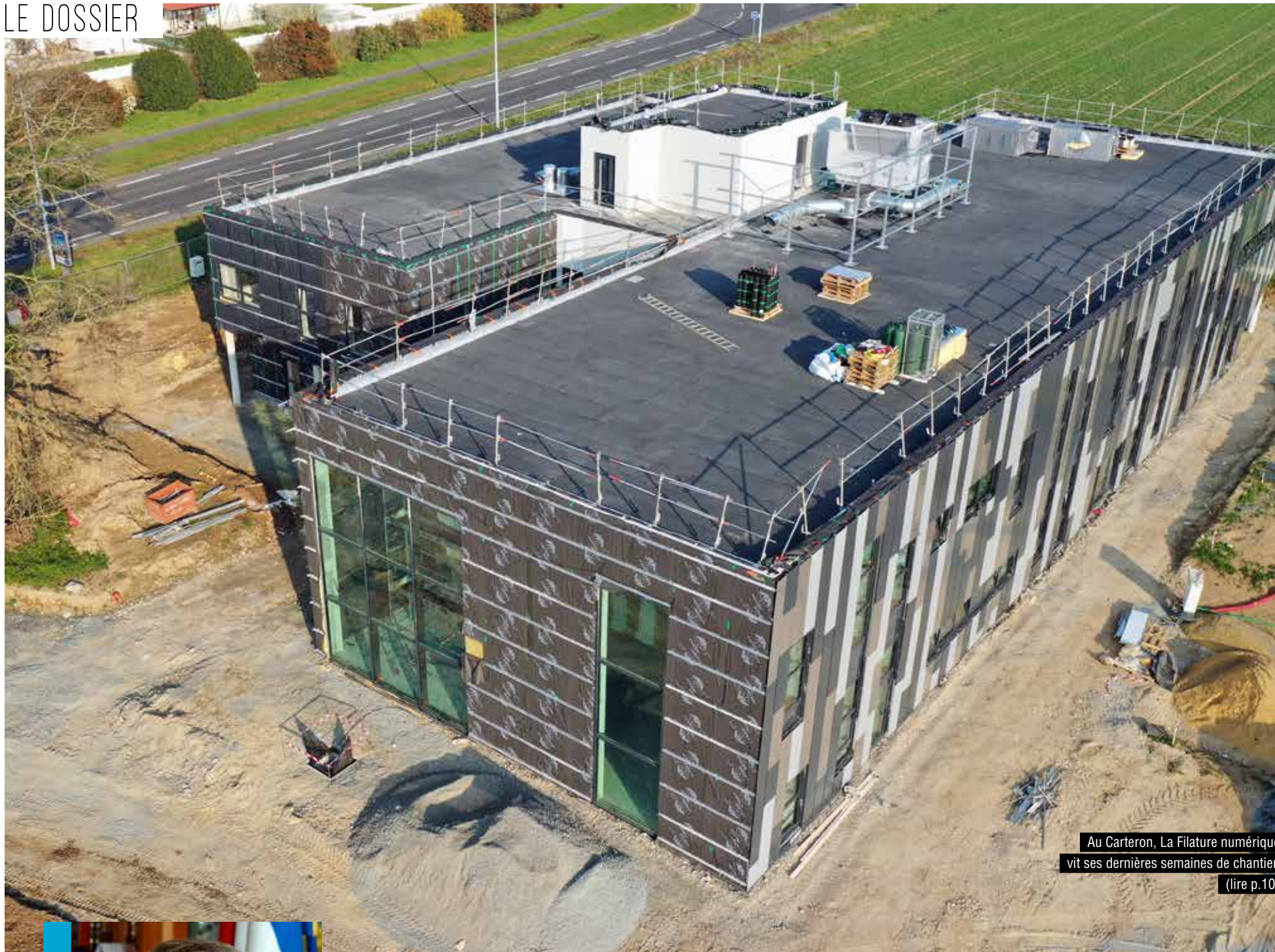
Au Carteron, La Filature numérique vit ses dernières semaines de chantier. (lire p.10)