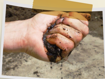
Compost trop humide