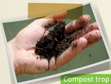
Compost trop sec