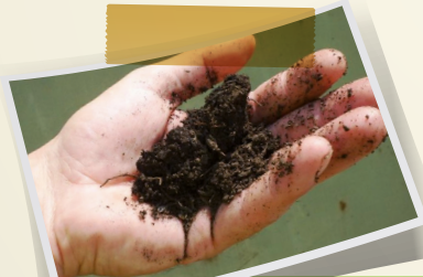
Compost trop sec