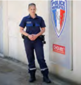
Agent de Police municipale