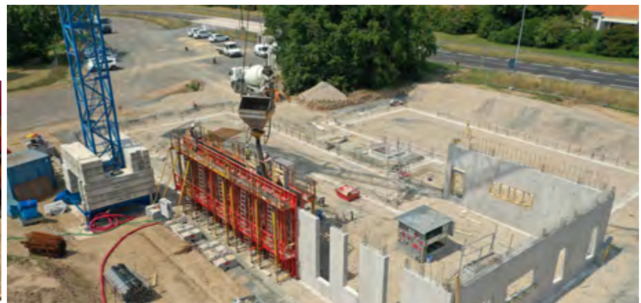
Parmi les grands projets, la Filature numérique, pôle digital en cours de réalisation au Carteron à Cholet