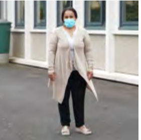
Animatrice auprès des enfants