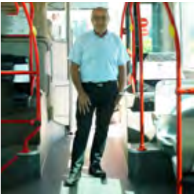
Chauffeur de bus