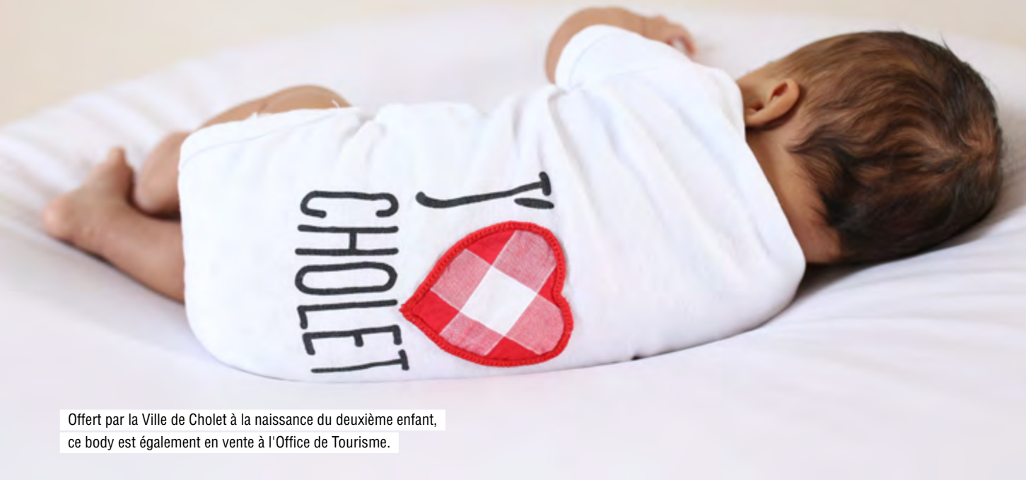
Offert par la Ville de Cholet à la naissance du deuxième enfant, ce body est également en vente à l'Office de Tourisme.