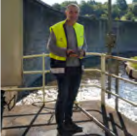
Agent missionné au contrôle des barrages