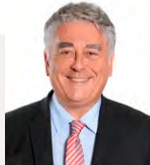
Gilles Bourdoleix Maire de Cholet Président de l'Agglomération du Choletais Député honoraire