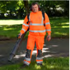
Agent de propreté voirie