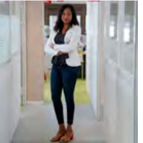
Agent à l'État civil