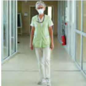
Agent aux soins en EHPAD