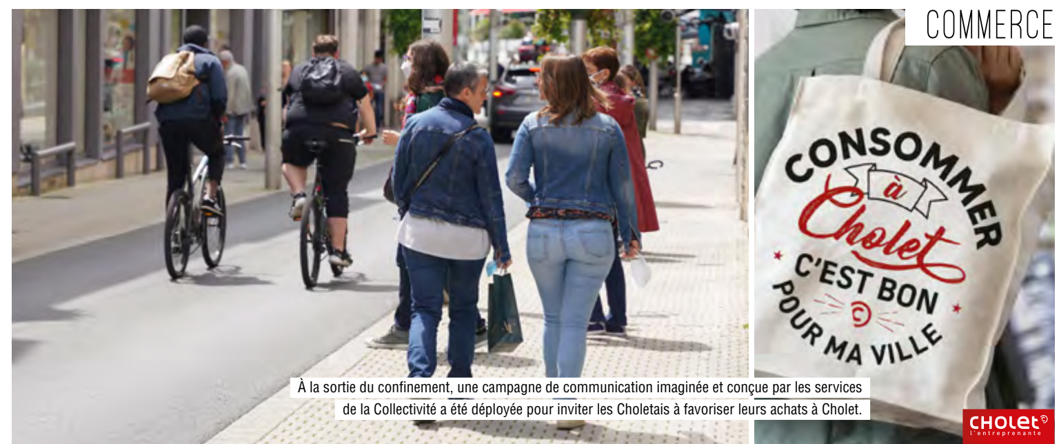
À la sortie du confinement, une campagne de communication imaginée et conçue par les services de la Collectivité a été déployée pour inviter les Choletais à favoriser leurs achats à Cholet.

D'ici là, l'Agglomération du Choletais reconduira ses opérations phares en faveur de l'emploi et de la formation : le Forum pour l'Emploi en mars, l'opération Jobs d'été-Jobs étudiants et bien sûr le Carrefour de l'Orientation, des Métiers et de l'Entreprise en janvier. Si les conditions sanitaires le permettent.