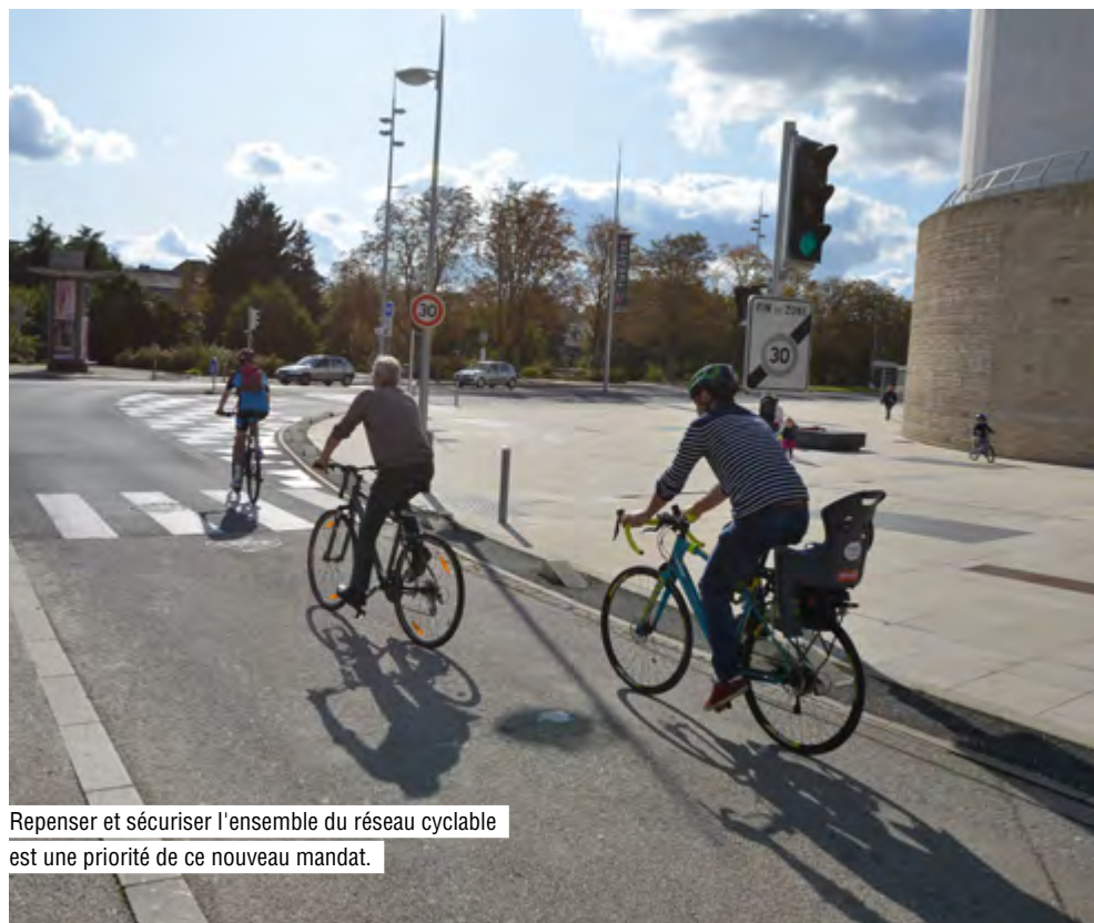
Repenser et sécuriser l'ensemble du réseau cyclable est une priorité de ce nouveau mandat.

Organiser l'espace public avec le concours des citoyens résume clairement la politique de concertation mise en place depuis des années. Dans une ville où l'on recense un arbre pour trois habitants, où le fleurissement est récompensé par des distinctions à l'échelle nationale, comme la Fleur d'Or obtenue en 2019, l'avenir se prépare dans un souci d'attractivité, de fonctionnalité et de modernité. Le mandat 2020/2026 met plus que jamais l'accent sur la participation citoyenne.