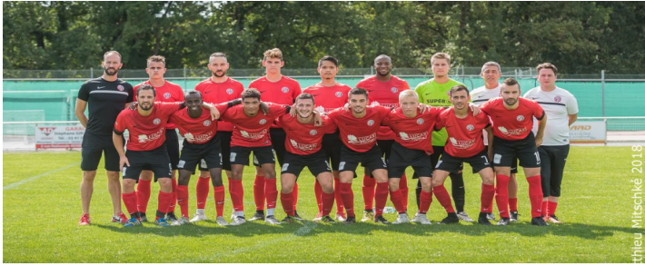
L'équipe 1 ère aura réalisé une belle saison en D1.

La saison 2018/2019 aura été une nouvelle fois positive pour l'AS Puy-Saint-Bonnet Football. Les joueurs des équipes de jeunes ont continué à progresser tout au long de l'année. La cerise sur le gâteau est venue des U19 qui remportent le Challenge de l'Anjou après sa victoire 2-1 contre le GJ Soucelle Corzé. Un signe que le travail effectué auprès des jeunes depuis plusieurs années paye.