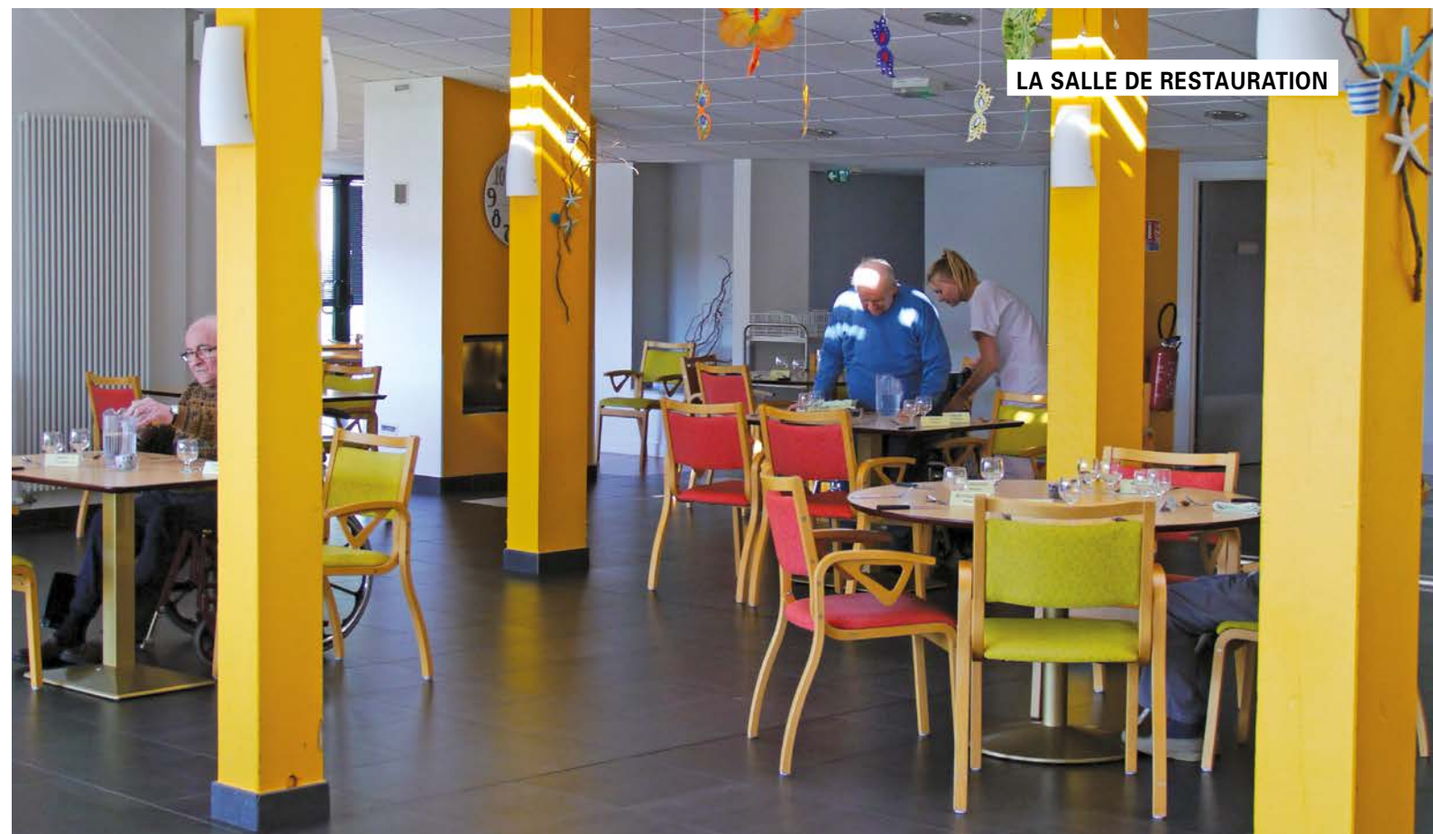
LA SALLE DE RESTAURATION

Vous avez la possibilité de pratiquer en toute liberté le culte de votre choix et de vous recueillir seul ou avec d'autres résidents, dans l'oratoire, en accès libre.