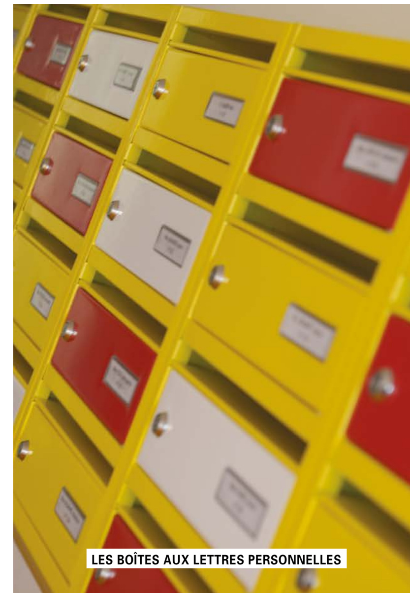
LES BOÎTES AUX LETTRES PERSONNELLES

Les agents de La Poste passant quotidiennement, vous pouvez déposer vos enveloppes timbrées dans la boîte "départ du courrier".