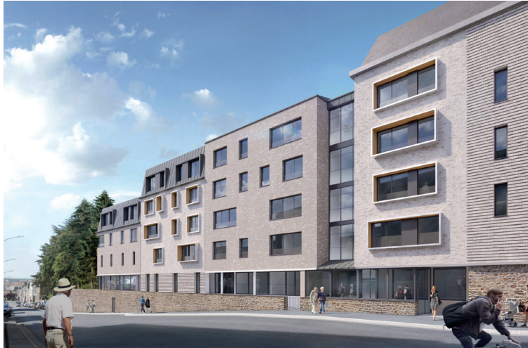
© Agence Grégoire Architectes et A propos