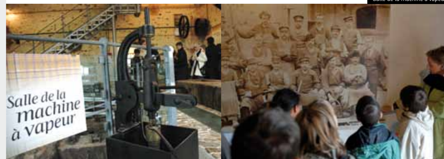
Salle de la machine à vapeur