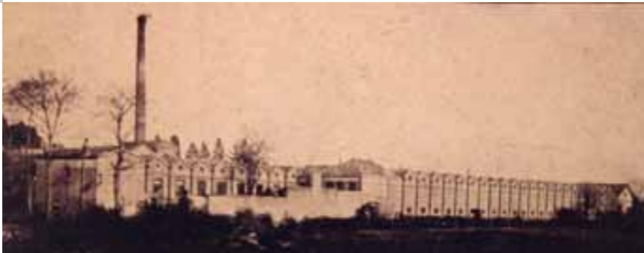
Tissage du Bordage Marc à Cholet