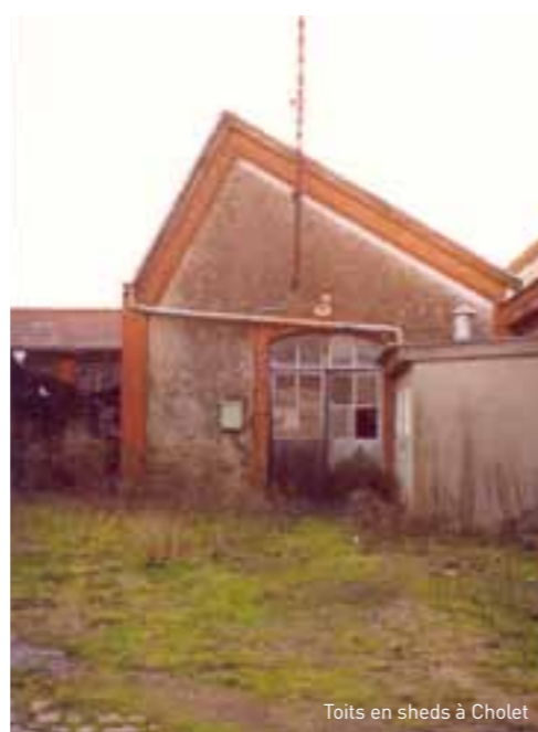
Toits en sheds à Cholet

Née de transformations techniques, la Révolution Industrielle entraîne en un siècle une transformation radicale du monde économique devenu le modèle de la société actuelle.