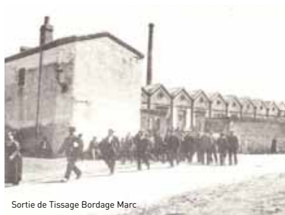
Sortie de Tissage Bordage Marc