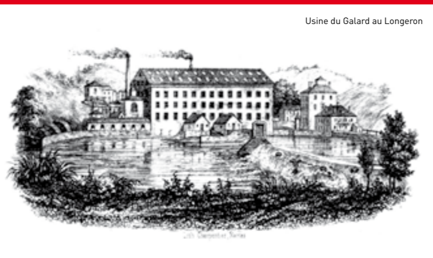
Usine du Galard au Longeron