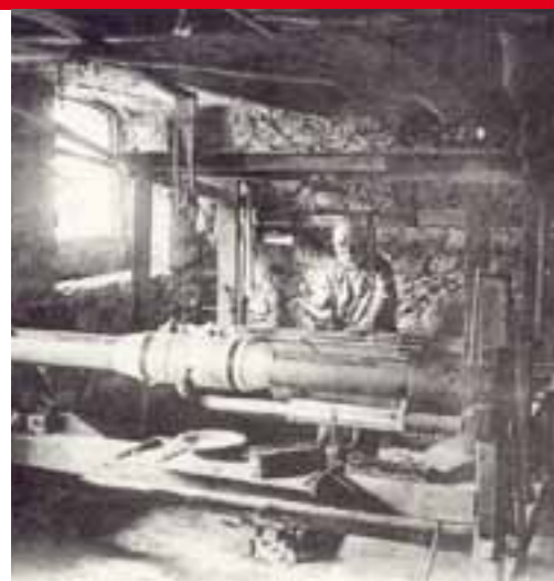
Tisserand en cave