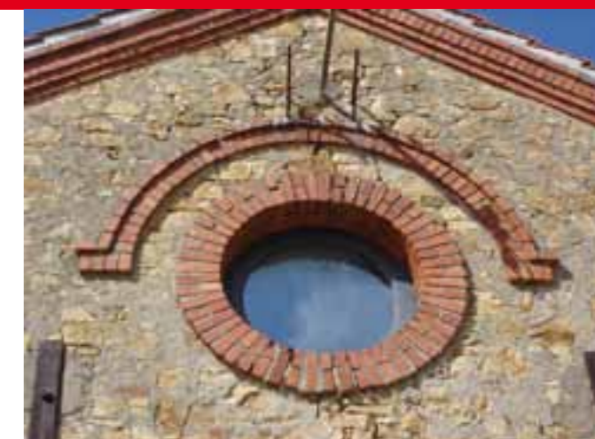
Pignon de la blanchisserie de la Rivière Sauvageau