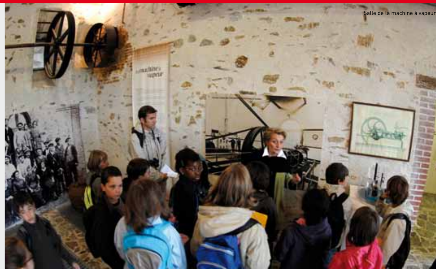
Salle de la machine à vapeur